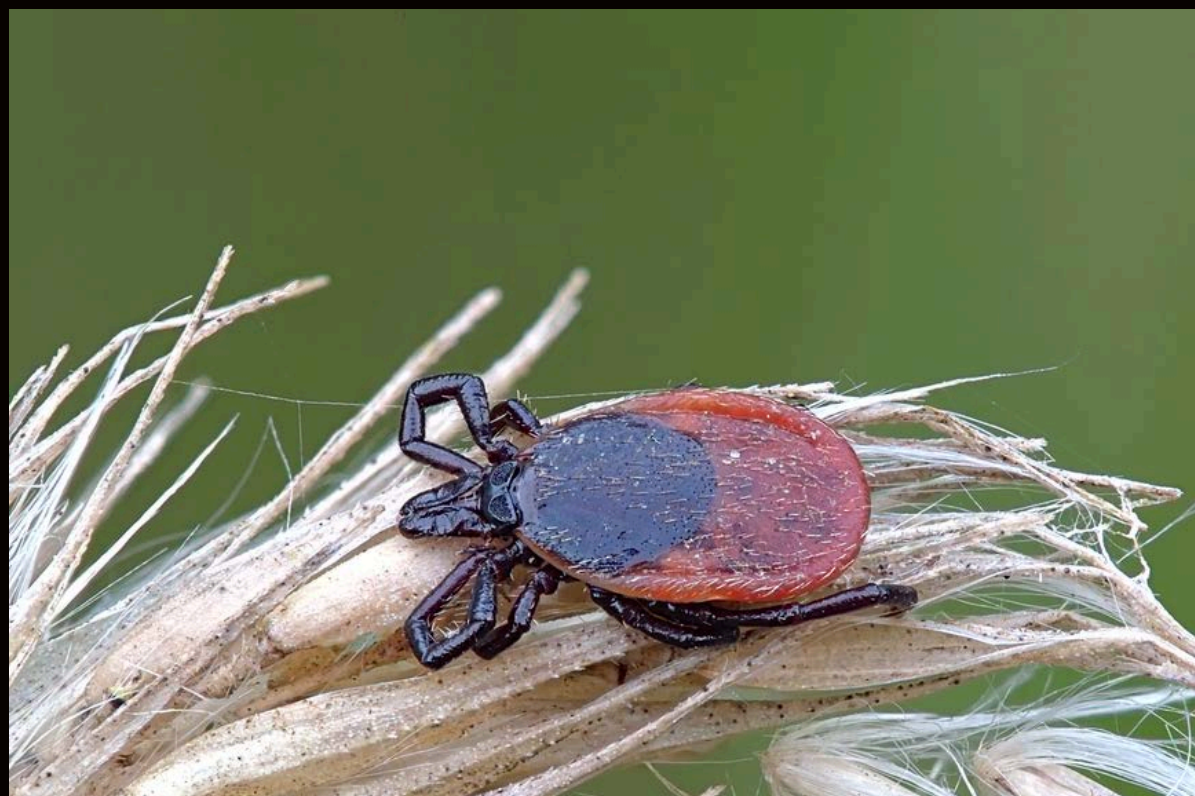
Клещ ( Ixodes ricinus )

В целях профилактики малярии, клещевого энцефалита и др., санитарная станция проводила мероприятия по исследованию и выявлению природных очагов заболеваний, подготовке методических рекомендаций и прочее.