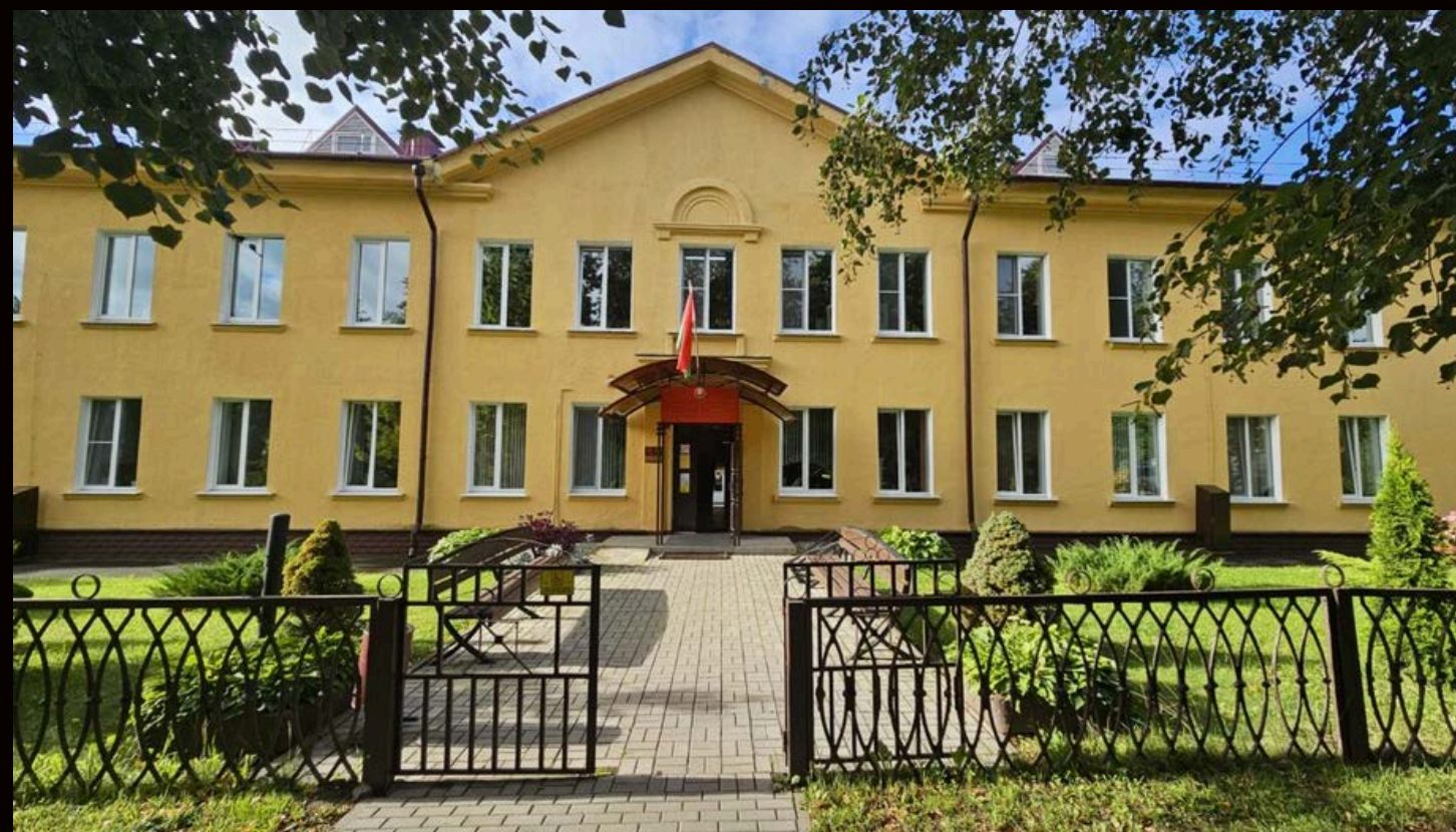
Здание ГУ «Молодечненский зональный центр гигиены и эпидемиологии»

Государственным учреждением «Молодечненский зональный центр гигиены и эпидемиологии» (далее — Молодечненский зональный ЦГЭ) проводится мониторинг среды обитания, контролируются параметры загрязнения питьевой и речной воды, атмосферного воздуха и воздуха рабочей зоны, продуктов питания и товаров народного потребления, проводится государственная гигиеническая регистрация товаров народного потребления. Лабораторная служба Молодечненского зонального ЦГЭ аккредитована на проведение 476 видов исследований.