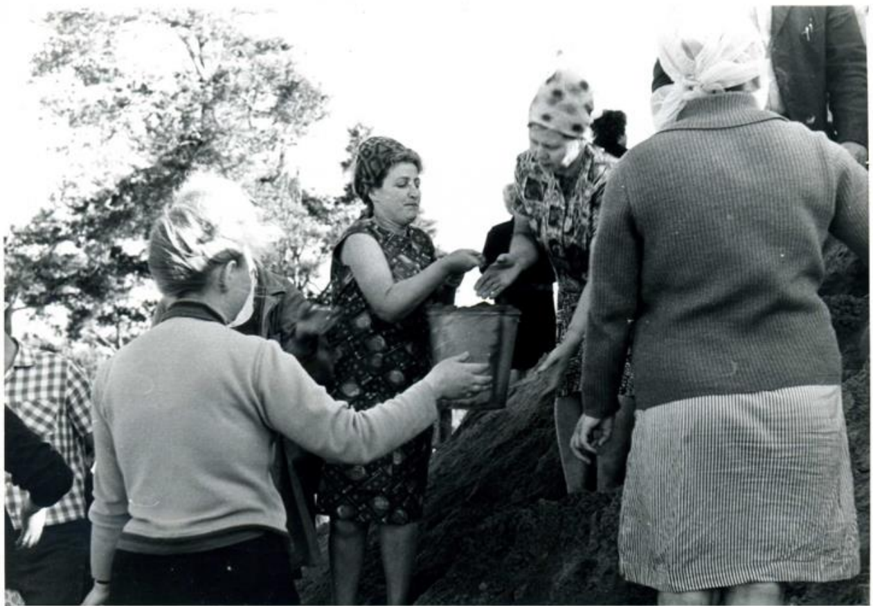
Рабочие города насыпают Курган Бессмертия. 1966 год.

3 ДЕНЬ. 17 часов 30 минут. От подножия до вершины Кургана образовалось 8 двойных цепочек. По этому живому конвейеру плывут вверх вёдра, полные земли. Растёт в высоту и заполняется конус Кургана. Вершина его уже поднялась на 7 метров. Одновременно работает около 1750 человек из 39 организаций и учреждений. В самом многочисленном составе городской узел связи – 92 человека, Полоцкая дистанция пути – 37 человек, ТЭЦ – 43 человека, горком КПБ в составе – 49 человек.