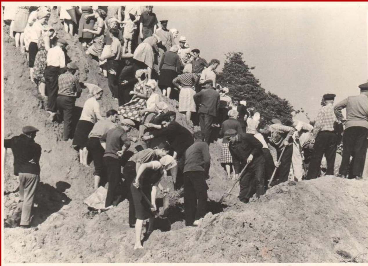
Возведение Кургана Бессмертия. Полоцк, 1966 год. Ф.1164.Оп.11.Д.95.Л.2

ДЕНЬ ШЕСТОЙ возведения Кургана Бессмертия.