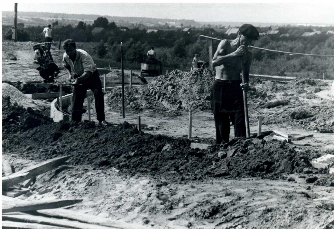
Закладка основания Кургана. 1966 год.