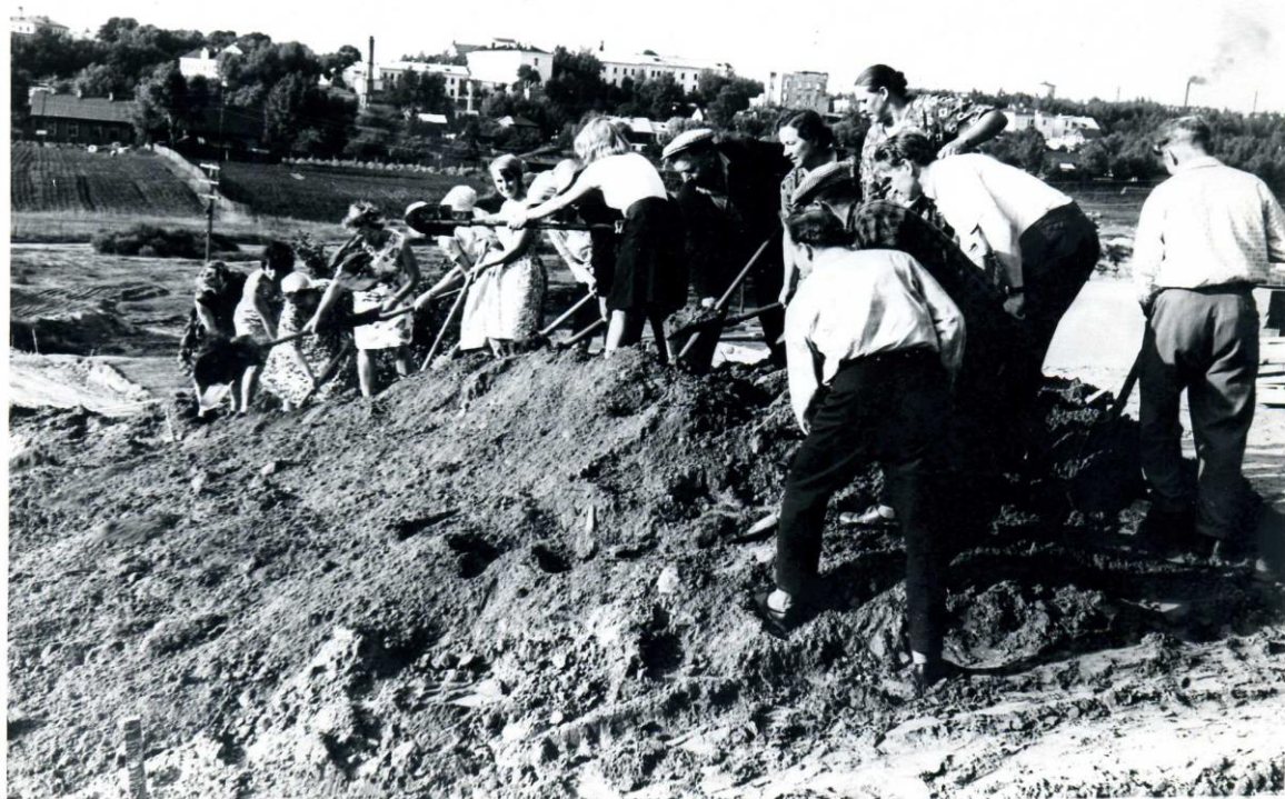
Закладка Кургана Бессмертия. 1966 год.

непрошенная, мужская, одна единственная слеза скатывается по седой бороде.