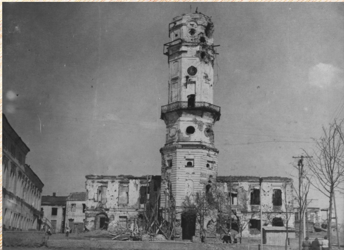
Ратуша 1944 год