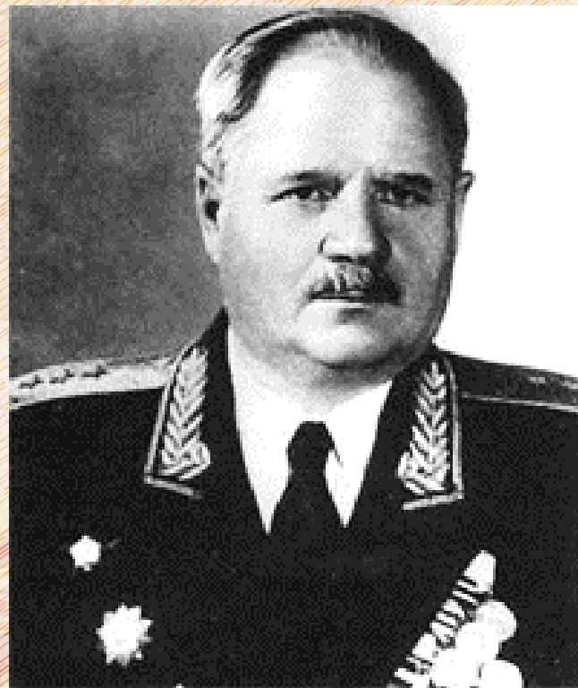
Генерал-лейтенант Иван Васильевич Болдин