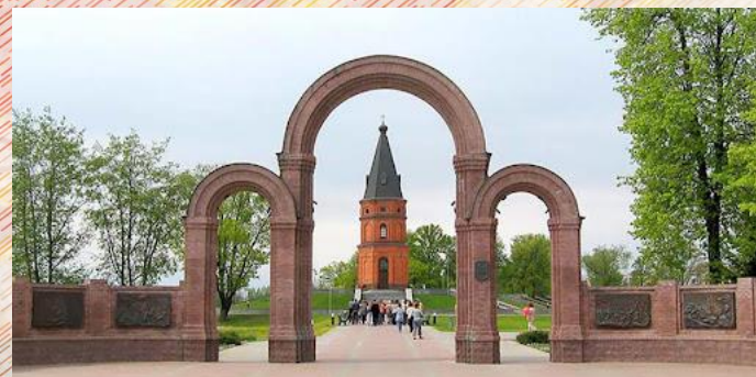
Мемориальный комплекс «Буйничское поле»