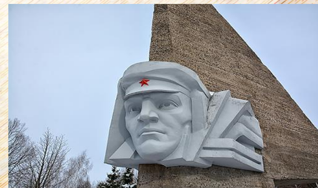
Мемориал воинам батальона милиции деревни Гаи