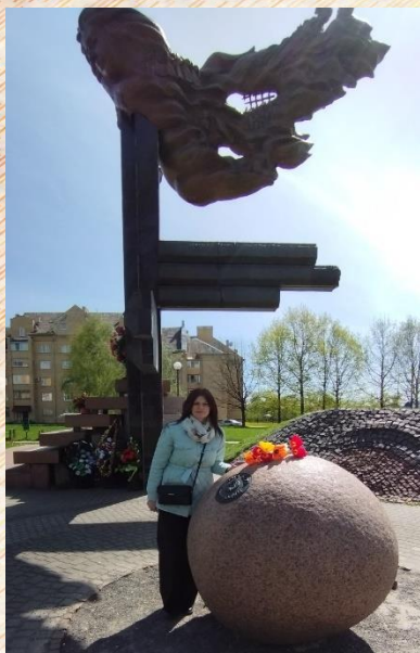
Мемориал «Детям войны»