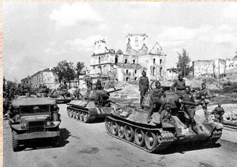
Освобожденный г. Могилев