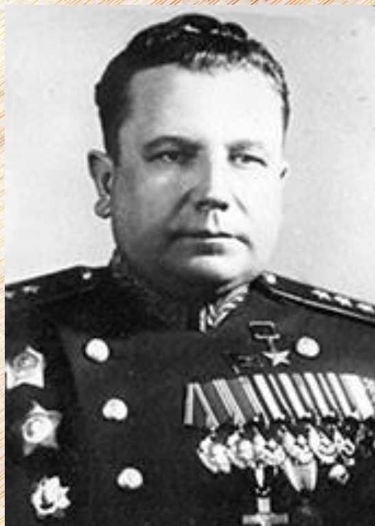
Генерал-полковник Иван Тихонович Гришин