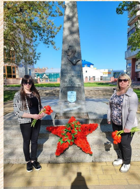
Памятник генерал-майора И.С. Лазаренко