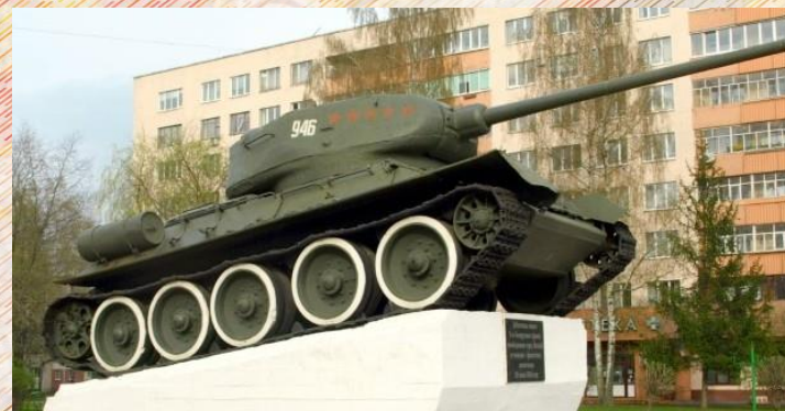
Знаменитый танк «Т-34» в честь воинов 2-го Белорусского фронта, освобождавших Могилев