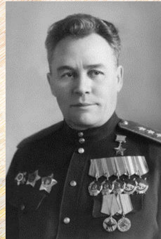
Генерал-полковник Константин Андреевич Вершинин