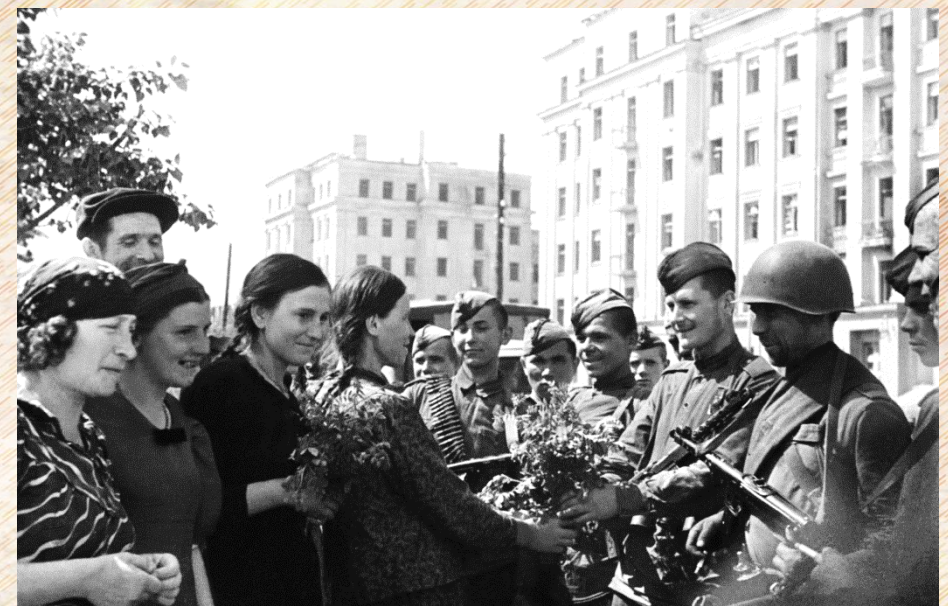
Жители г. Могилева встречают солдат Красной Армии

Информационная записка секретаря Могилевского обкома КП(б)Б по пропаганде и агитации тов. Новикова от 11 июля 1944 года секретарю ЦК КП(б)Б тов. Пономаренко П.К. о проведении 9 июля 1944 года в г. Могилеве митинга, посвященного освобождению города от немецко-фашистских захватчиков.