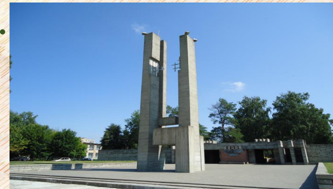
Мемориальный комплекс «Луполовский лагерь смерти»