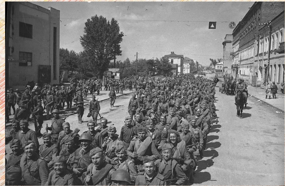
Войска Красной Армии входят в освобожденный г. Могилев

После митинга состоялся парад партизан и партизанок, представителей воинских частей освободивших г. Могилев. Около трибуны митинга прошло 9 000 партизан и партизанок. Трудящиеся города горячо приветствовали своих освободителей – воинов Красной Армии.