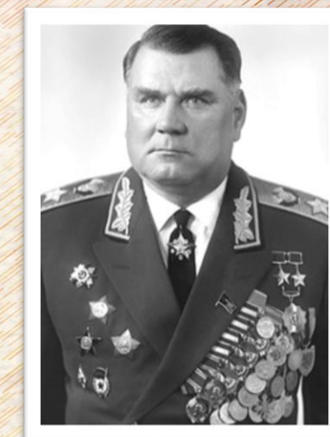
Улица Якубовского носит имя дважды Героя Советского Союза И.И. Якубовского