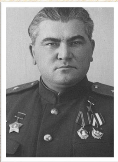
64-я стрелковая дивизия (генерал-майор Т.К. Шкрылёв)