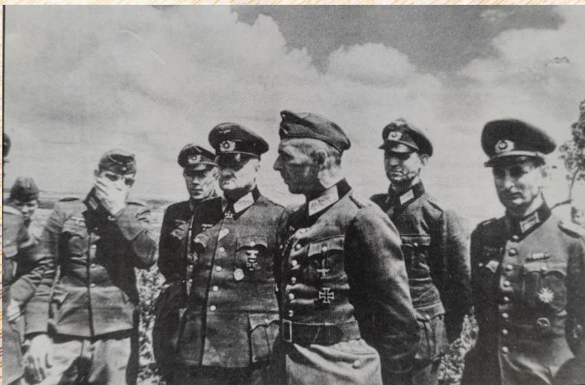
Плененные офицеры штаба 12-й пехотной дивизии (в центре – генералы Бамлер и фон Эрдмансдорф)

На допросе комендант Могилева генерал майор фон Эрдмансдорф рассказал: «28 июня 1944 года, примерно в 3.15 ночи мне доложили, что противник вторгся в город с юга и востока. Связи с какими-либо частями у меня не было. Считая дальнейшее сопротивление бессмысленным, я и генерал Бамлер сдались в плен первому же русскому солдату».