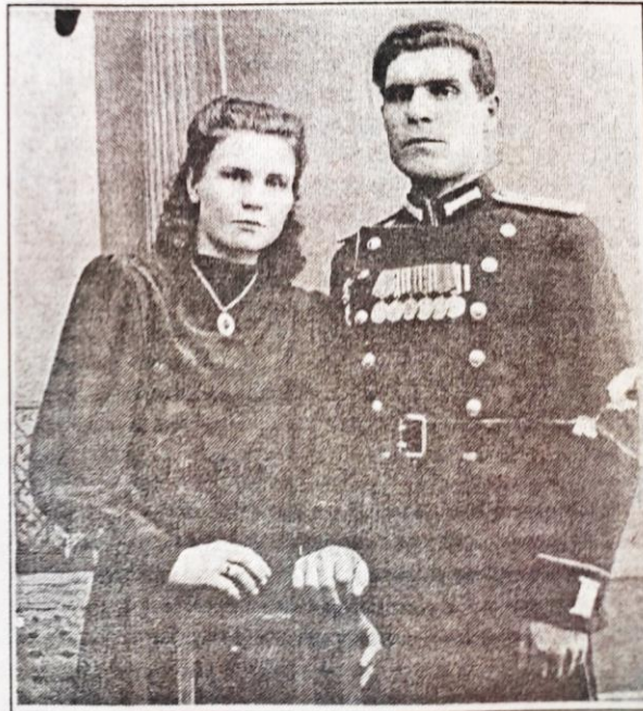
Газета «Могилевская правда» от 05.09.2000