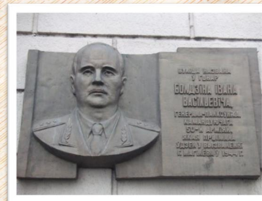
Улица Болдина называется в честь командующего 50-й армией И.В. Болдина