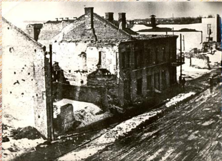
Разрушенный г. Могилев. Улица Первомайская, 1944 г.

Наша 238-я Карачевская стрелковая дивизия и ее 830, 837 и 843-й полки Указом Президиума Верховного Совета СССР за успешное форсирование Днепра и освобождение Могилева награждены орденом Красного Знамени».