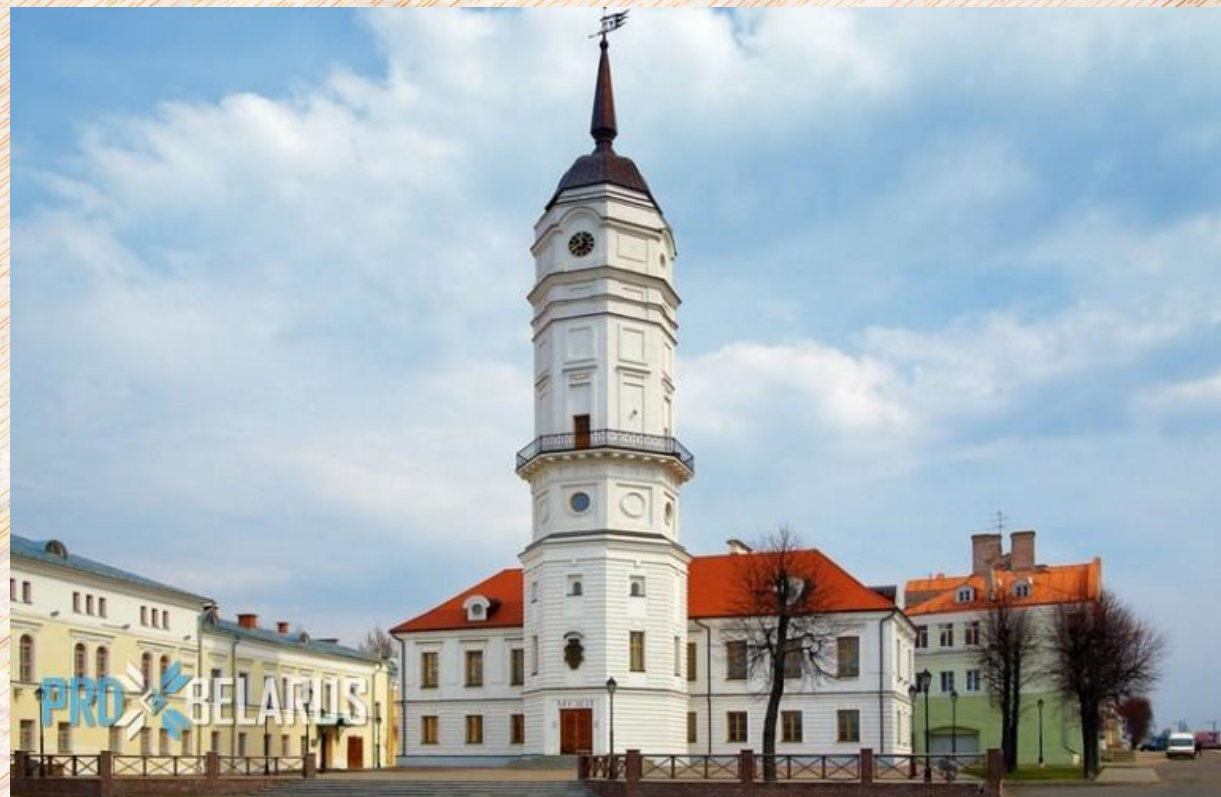
Ратуша 2024 год