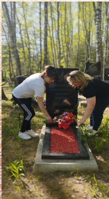
Братская могила в д. Селец Чаусского района