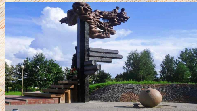
Мемориал «Детям войны»