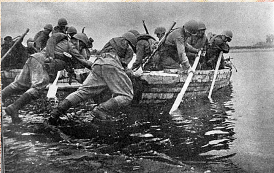
Форсирование Днепра в районе Могилева