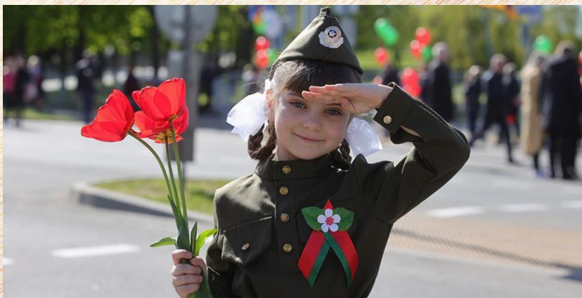
Юная могилевчанка на параде Победы