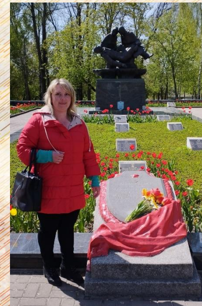
Памятник подпольщикам Могилева, погибшим в борьбе с фашистскими оккупантами в 1941-1945 г.г.