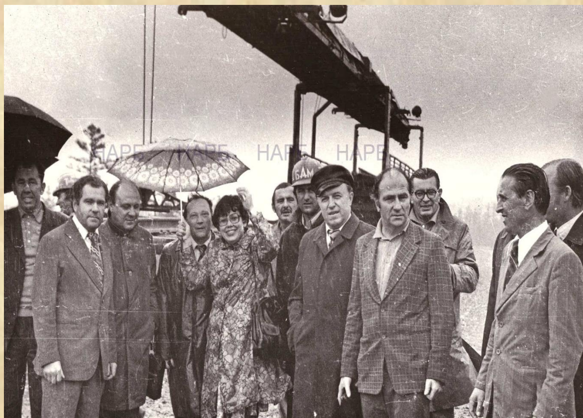
Толстик А.А. (первый ряд, третий справа) во время посещения строительного участка Байкало-Амурской магистрали. 1978 г.