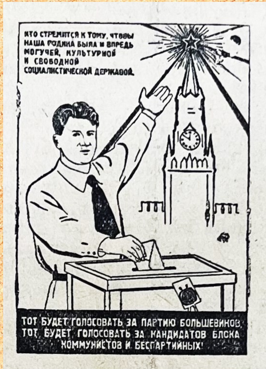
«Соцыялістычная перамога» № 82 от 01.06.1938 г.

28 мая 1938 года началась предвыборная агитация за кандидатов в депутаты и встречи избирателей с кандидатами