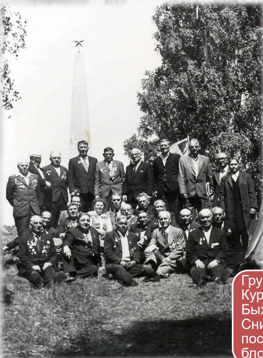
Группа партизан-гришинцев возле Кургана Бессмертия в д. Дабужа Быховского района Могилевской области. Снимок с партизанского слета, посвященного 40-летию прорыва Бовской блокады. (25 июня 1983 г.).