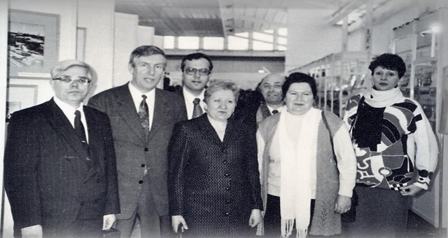
Директор Государственного комитета по архивам и делопроизводству Республики Беларусь В.И.Адамушко и директор Национального архива Республики Беларусь В.Д.Селеменев с сотрудниками комитета и архива. 1999 г.