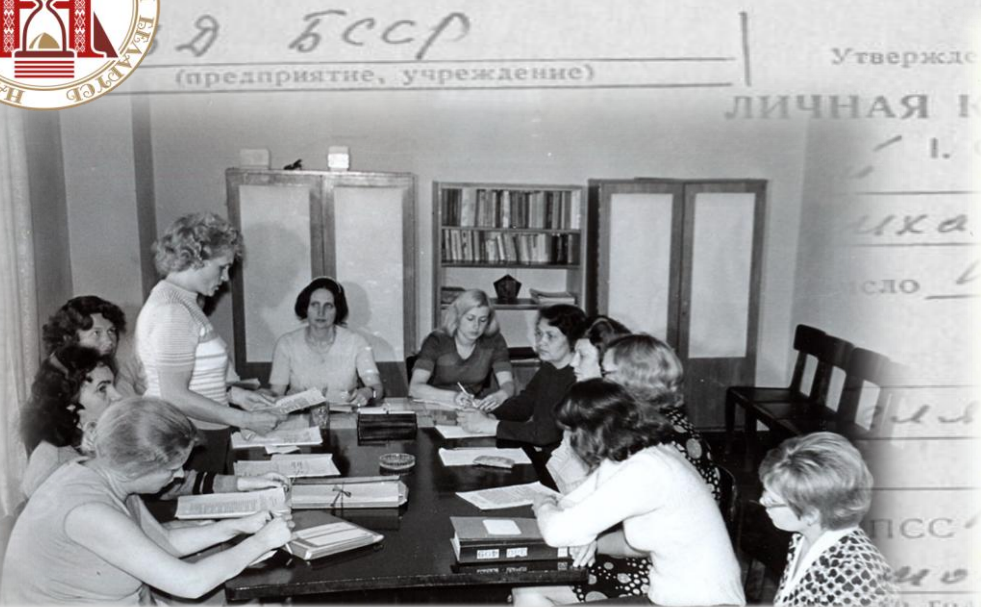
Заседание экспертно-проверочной комиссии Центрального государственного архива Октябрьской революции БССР. 1977 г.

С П Р А В К А Типовая ф. № 208 -15 Утвержде о состоянии и использовании документальных материалов Государственного архивного фон- да Б С С Р