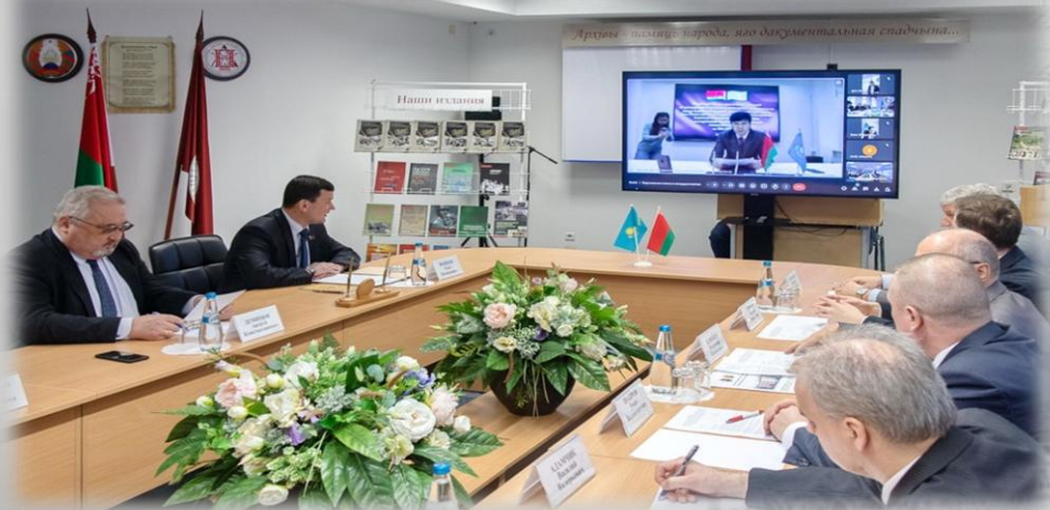
Подписание Плана практических действий по расширению культурно-гуманитарного сотрудничества архивных служб Республики Казахстан и Республики Беларусь на 2024-2029 годы. г.Минск. 2024 г.