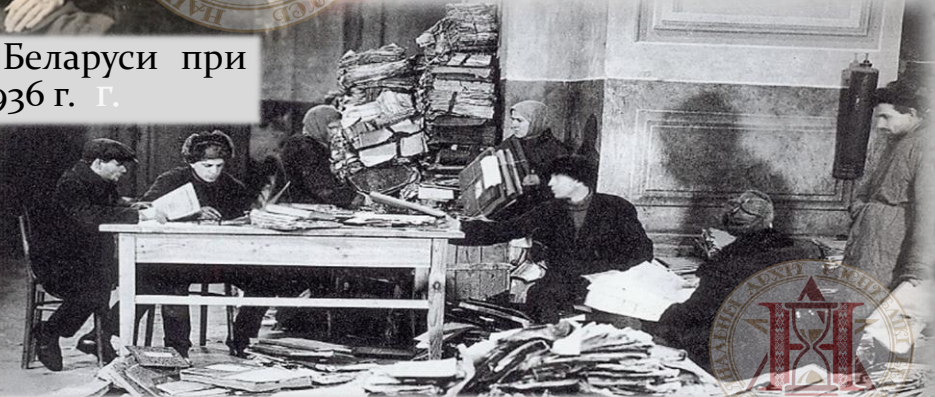
Сотрудники Центрального архива Октябрьской революции БССР за разборкой документов. 1936 г.

в дальнейшем останешься в первых рядах главных бойцов строителей первого в мире социалистического государства.