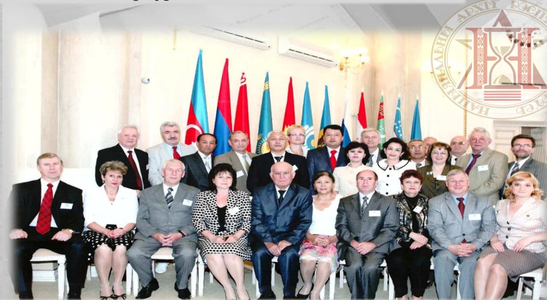
Участники конференции Евро-Азиатского регионального отделения Международного совета архивов (ЕВРАЗИКА). г. Минск. 2011 г.