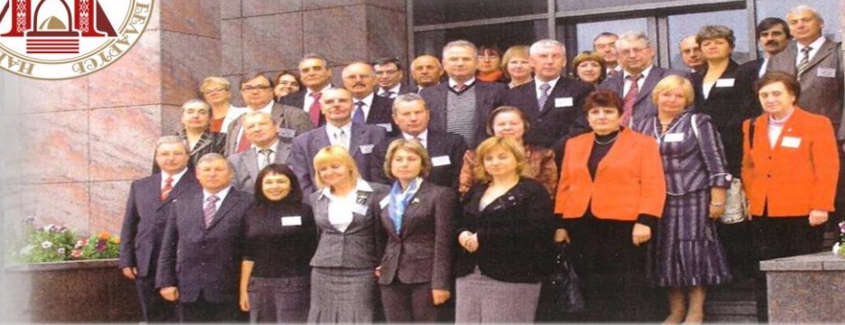
Встреча руководителей архивных служб и архивных учреждений России, Беларуси, Украины в г. Санкт-Петербурге. 2008 г.