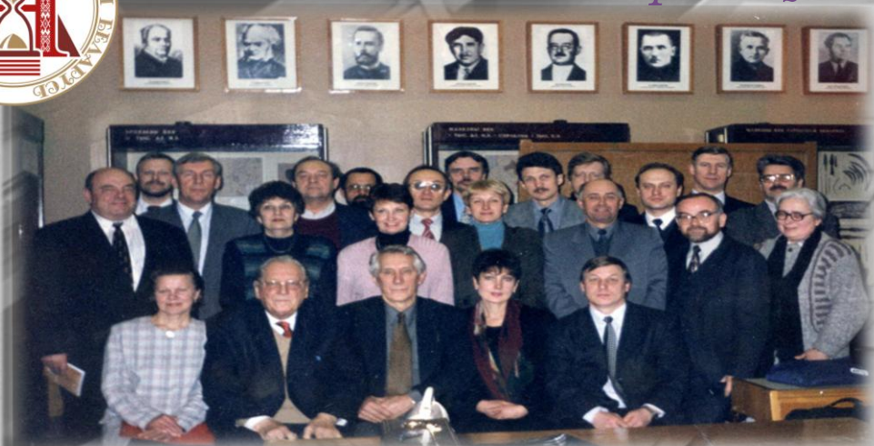
Руководители республиканских архивов Беларуси с профессорско-преподавательским составом Белорусского государственного университета. 1999 г.