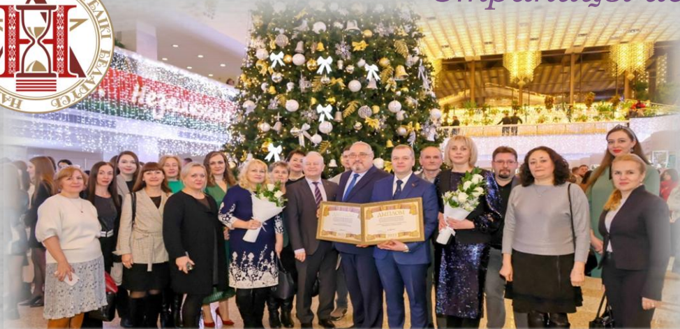
Присуждение специальной премии Президента Республики Беларусь «За духовное возрождение» Национальному архиву Республики Беларусь и издательскому дому «Беларусь сегодня». г.Минск. 2022 г.