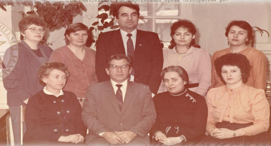
Сотрудники Центрального Государственного архива научно-технической документации БССР. 1987 г.