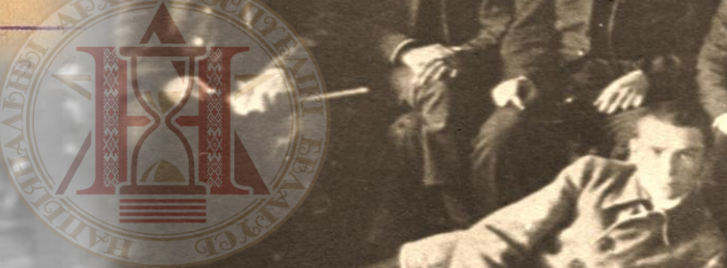
Учаснікі 1-го Всебелорусского совещания архивистов. 1924 г.