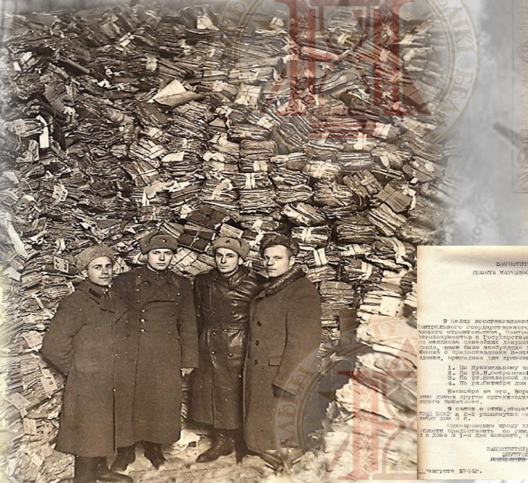
Возвращенные Центрального Октябрьской БССР. 1946 г. документы архива революции