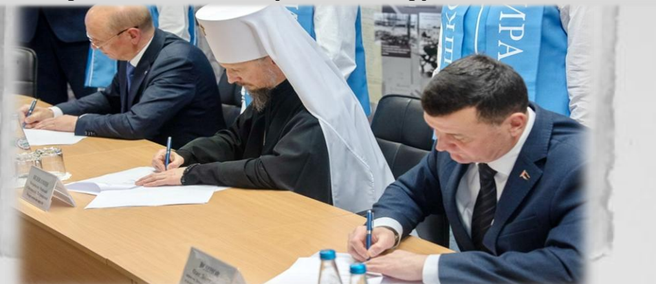
Подписание меморандума о сотрудничестве между ОО «Белорусский фонд мира», Департаментам по архивам и делопроизводству Министерства юстиции Беларусь и Белорусской православной Церковью. г.Минск 2024 г.