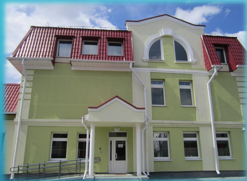
Здание архива по ул. Победы, 63

По состоянию на 01.01.2022 на балансе архива числятся 2 здания: