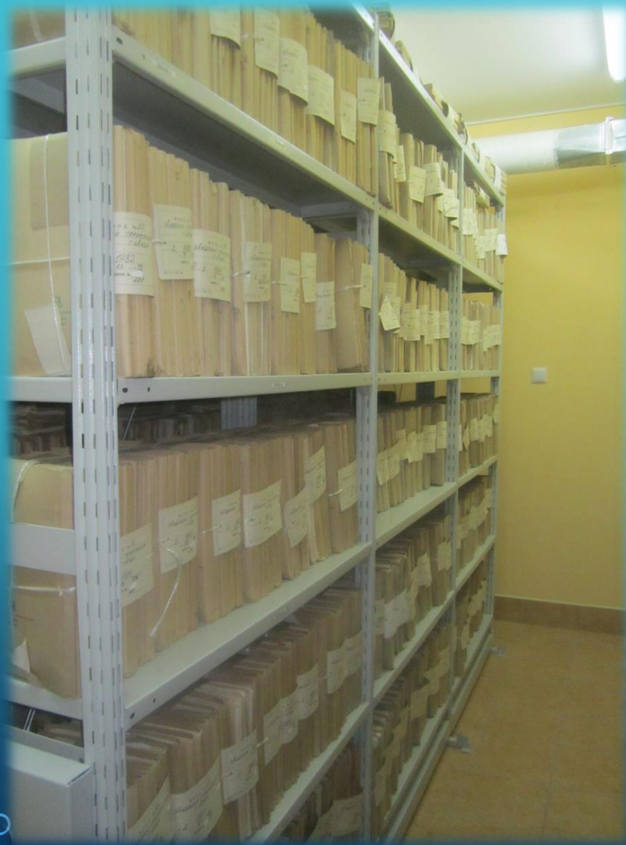
Архивохранилища №№ 3-4, расположенные на втором этаже