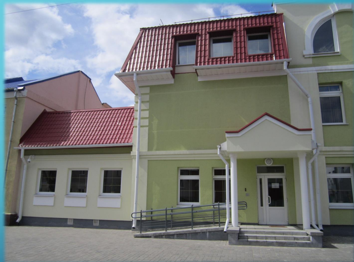
Читальный зал (пристройка)