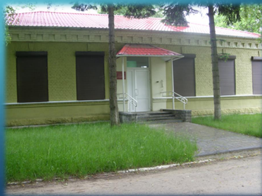
Архивохранилище № 6 по ул. Невского, 13 б