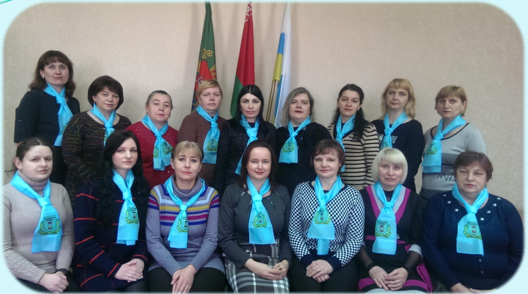
Коллектив Госархива в г. Глубокое, 2019 г.