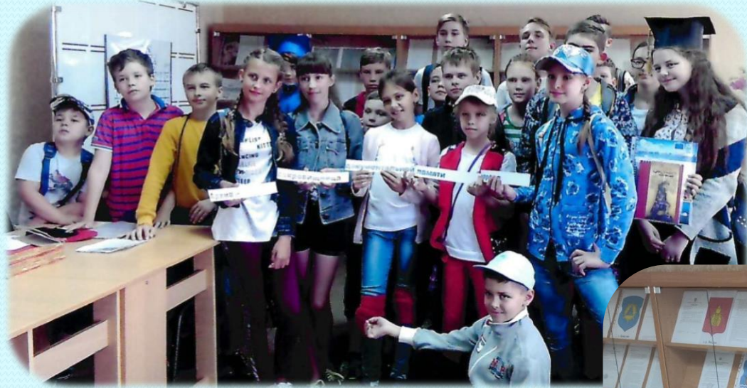
Участники архивного квеста «История в архивных документах», 2019 г.