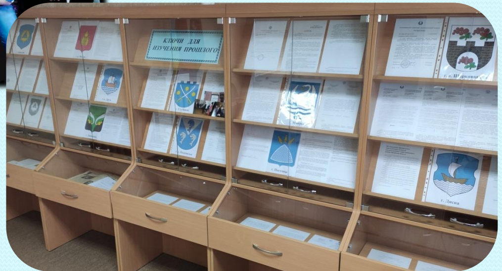
Выставка архивных документов «Ключи для изучения прошлого» в читальном зале архива, 2021 г.