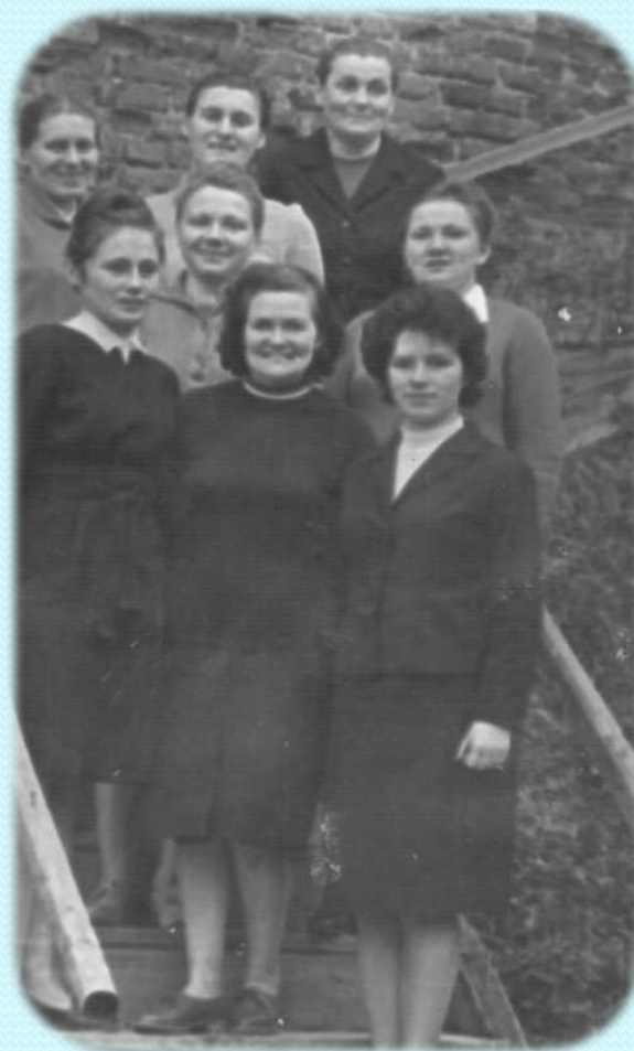
Сотрудники архива, 1966 г.