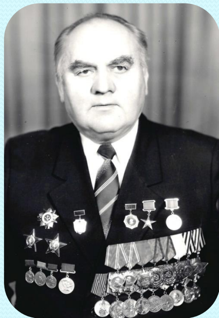
Пуговко Л. К., Герой Социалистического Труда (1958 г.)