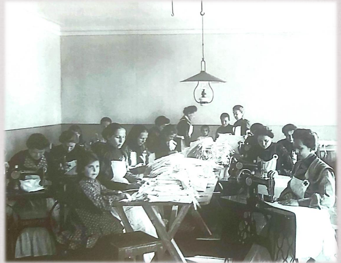
Швейная майстэрня ў прытулку