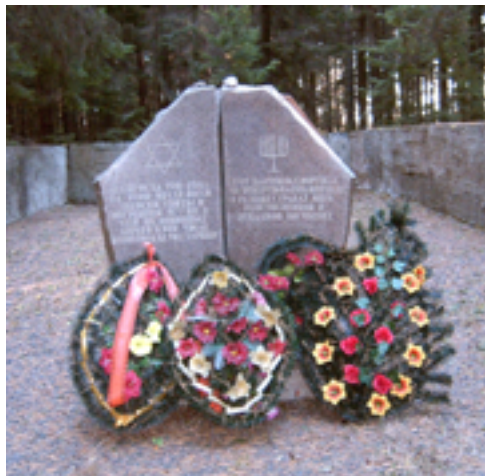
Памятник на месте расстрела узников Зембинского гетто.