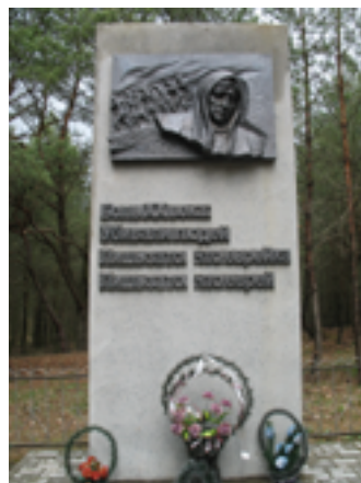
Памятник на месте гибели евреев гетто в д. Давыдовка. 2005 г.