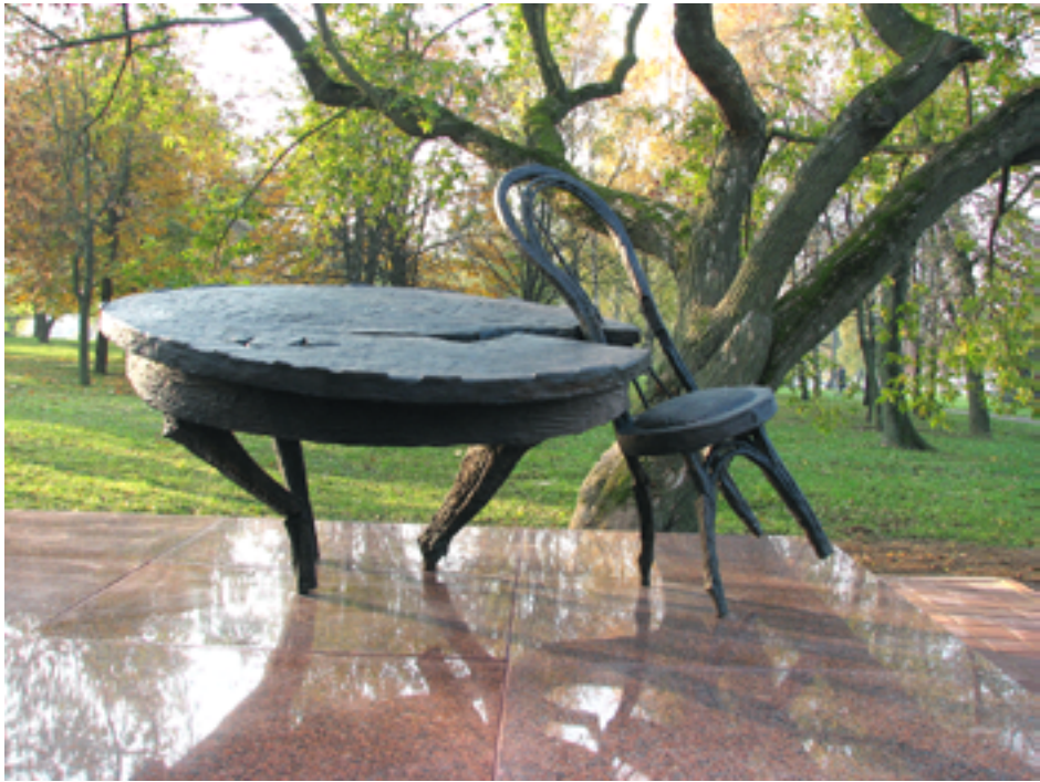
Мемориал-памятник узникам Минского гетто «Разбитый очаг» на улице Сухая. 2008 г.