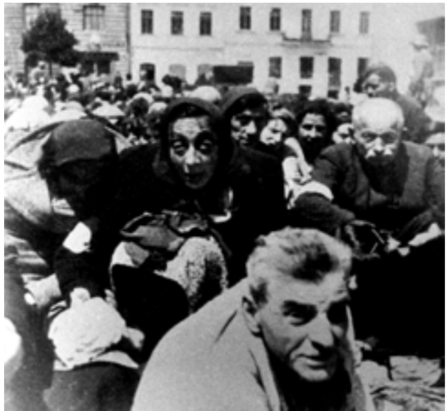
Во время переселения евреев г. Минска в гет- то. 1941 г.