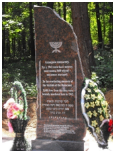
Памятники на месте уничтожения евреев в д. Молчадь.