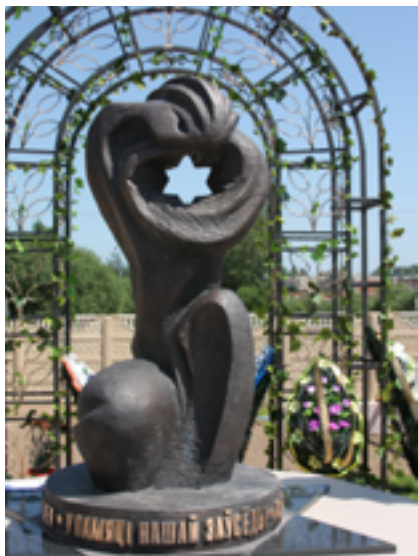
Памятный знак в Иловском (Туловском) овраге — на месте массового уничтожения узников Витебского гетто.