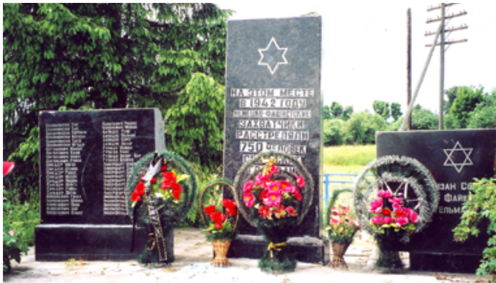
Памятник расстрелянным узникам гетто в д. Илья. Фото из Музея истории и культуры евреев Беларуси