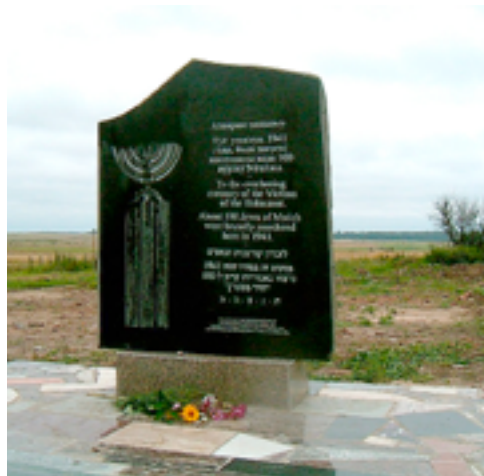
Памятник уничтоженным в 1941 г. евреям в д. Мстиж.