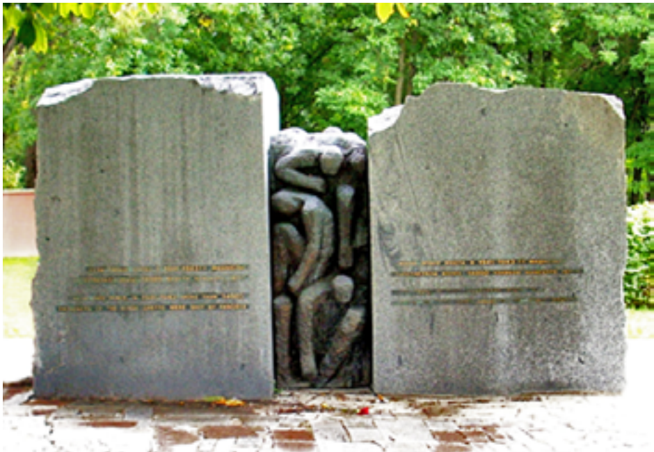
Памятник 14 000 евреям — узникам Минского гетто, убитым в Тучинке. 2008 г.