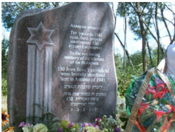
Памятник уничтоженным евреям в г. п. Езерище. 2007 г.