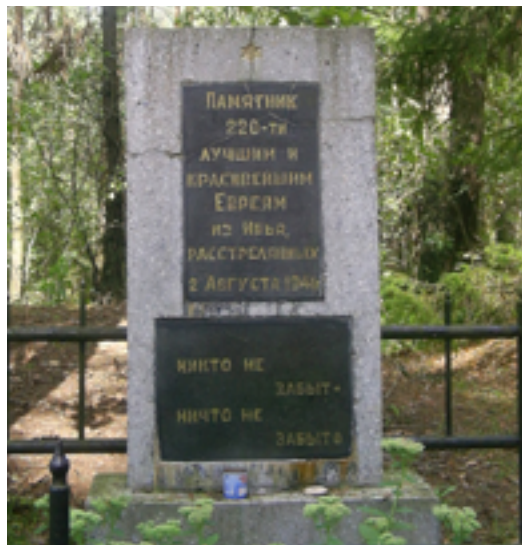
Памятник на месте уничтожения евреев в 1941 г. у д. Стоневичи. Фрагмент Мемориального комплекса в память ивьевских евреев – жертв Катастрофы.