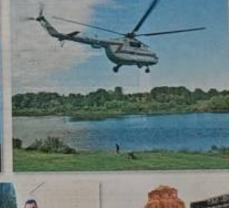
Вертолет в небе над Верхнедвинском.