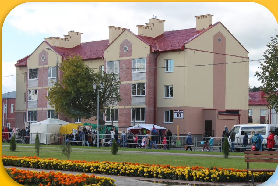
Новый дом, который построили к «Дожинкам»