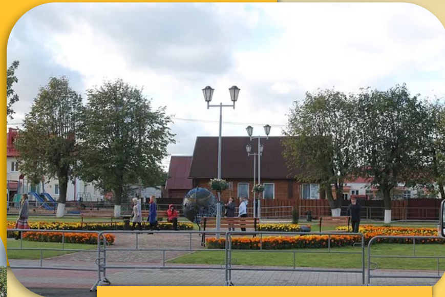
После реконструкции площадь в Верхнедвинске стала светлее