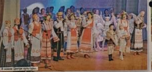
В новом Центре культуры.