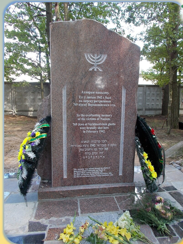
Новый памятник евреям — узникам Верхнедвинского гетто. Установлен в 2013 году.