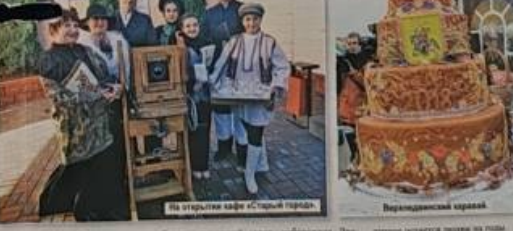
На открытии кафе «Старый парад».