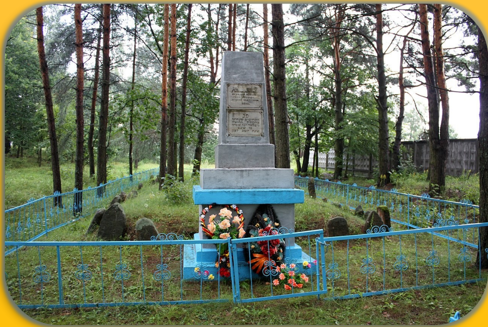
Памятник на могиле жертв фашизма — узников гетто в городе Верхнедвинск

До Великой Отечественной войны в городе проживала значительная часть евреев, уничтоженных в гетто в 1942 году. Сегодня на месте массовой гибели еврейского населения можно видеть памятник, напоминающий о тех трагических событиях.