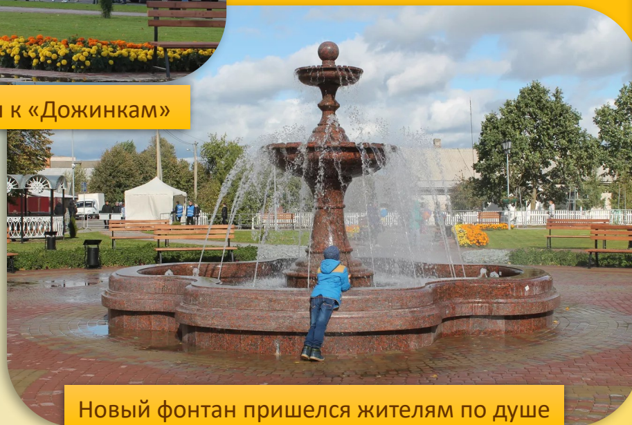
Новый фонтан пришелся жителям по душе

Сегодня Верхнедвинск – красивый благоустроенный город с населением более 7000 жителей.