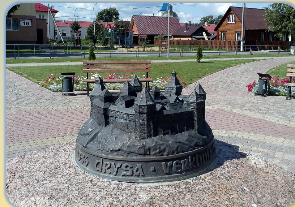
Макет Дриссенского замка на главной площади Верхнедвинска.