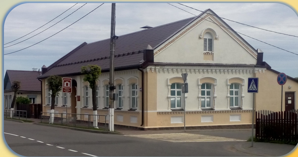
Верхнедвинский историко-краеведческий музей