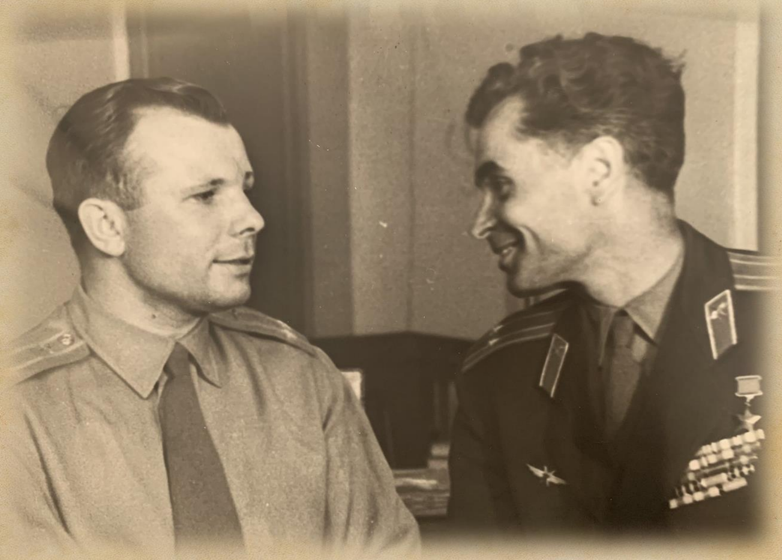
Лётчик-космонавт СССР, Герой Советского Союза Юрий Алексеевич Гагарин и Денисенко Григорий Кириллович. 18 мая 1963г. (Ф.366. Оп.1 Д.4 Л.6)