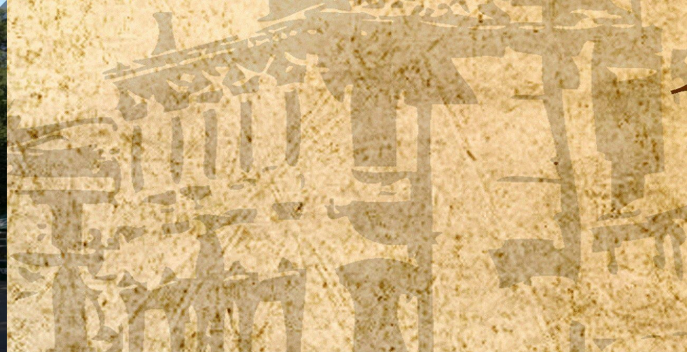
Борисовская детская музыкальная школа искусств