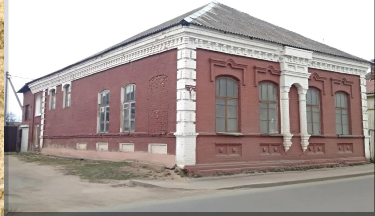
Бывшая синагога «Хевре Тылим»

Духовный иудейский комплекс был построен в 1911 году. До сегодня дожил только флигель синагоги. Это одноэтажное кирпичное здание с богатым фасадным декором. Высокие окна украшены сандриками. Они попарно разделены декоративной нишей с фигурными колоннами. В нише установлена мемориальная доска.