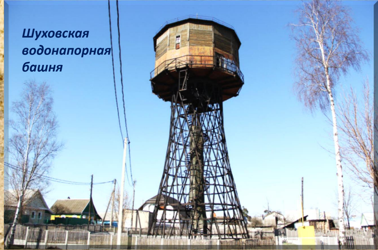
Шуховская водонапорная башня

Шуховская башня — уникальный памятник архитектуры. Она была построена в 1927 году великим советским инженером и учёным Владимиром Шуховым, стала первой в мире гиперболоидной водонапорной конструкцией. Сегодня существует лишь 11 сооружений подобного плана. Два из них расположены в Беларуси — в Борисове и деревне Звенячи.