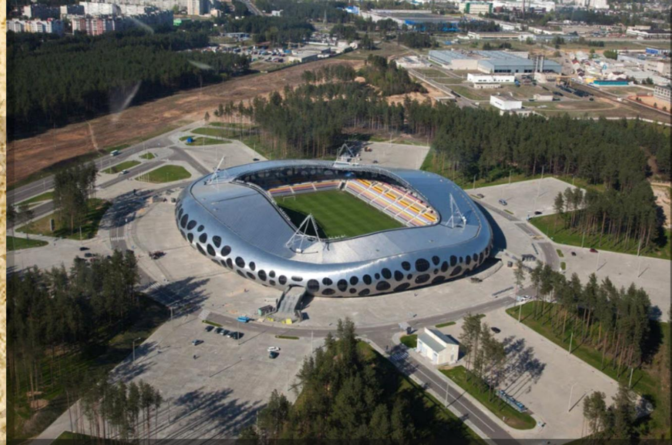
Спортивный комплекс «Борисов-Арена»

Издали привлекает внимание необычное здание в стиле деконструктивизма. Оно абсолютно лишено углов. Стены плавно изгибаются, образуя волнистое кольцо. Ещё больший эффект создают хаотично расположенные круглые окна. Внутри этого кольца расположен крупнейший футбольный стадион Борисова. Здесь проходят соревнования профессиональных команд из разных городов и стран. Также в комплекс входят: бильярдный зал; боулинг-клуб; студия экспериментального танца и гимнастики «Ультрамарин»; детский игровой центр; кафе и рестораны. «Фишкой» комплекса является фонтан «Футбольная экспрессия». Она изображает вратаря, который отбивает мяч. Абстрактная композиция выполнена из гладко отполированного гранита. Ночью включается подсветка, что придаёт фонтану ещё более эффектный вид.