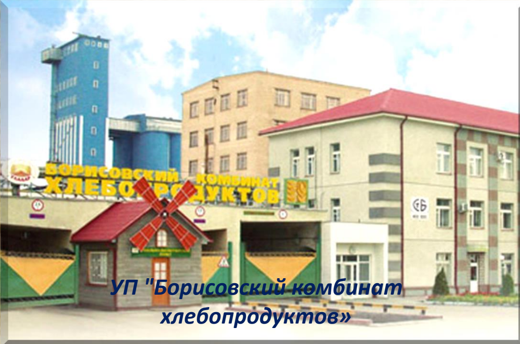
УП "Борисовский комбинат хлебопродуктов»