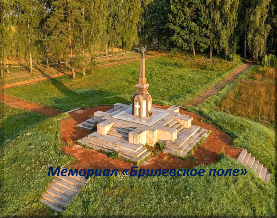
Мемориал «Брилевское поле»

Мемориал «Брилевское поле» состоит из нескольких памятников, расположенных на месте решающего сражения между русскими войсками и Великой армией Наполеона.