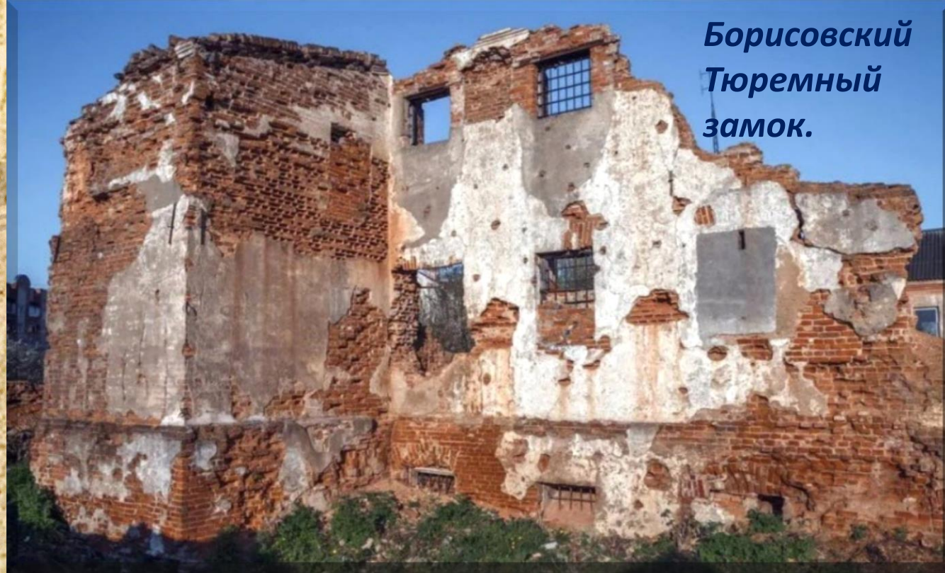
Борисовский Тюремный замок.

На сегодня замок разрушен — от него остались лишь руины и насыпные валы, заглушённые кустарниками. Наибольшее внимание привлекает здание тюрьмы, вернее его единственный уцелевший фасад. В кирпичной стене прорезаны окна, где всё ещё стоят решётки. Частично заметна рустовка. В краеведческом музее хранятся дореволюционные фотоснимки, на которых запечатлены ныне не существующие здания замка.