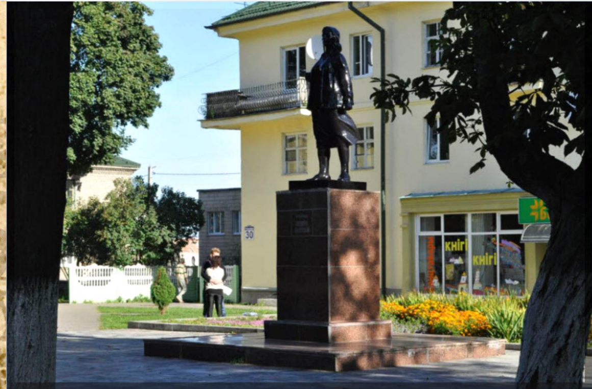
Памятник Люсе Чаловской

3 октября 1943 Люсю схватили фашисты. Более месяца отважную разведчицу жестоко пытали, а 6 ноября расстреляли. Памятник установлен в 1958 году. Его автор – скульптор С. Силиханов.