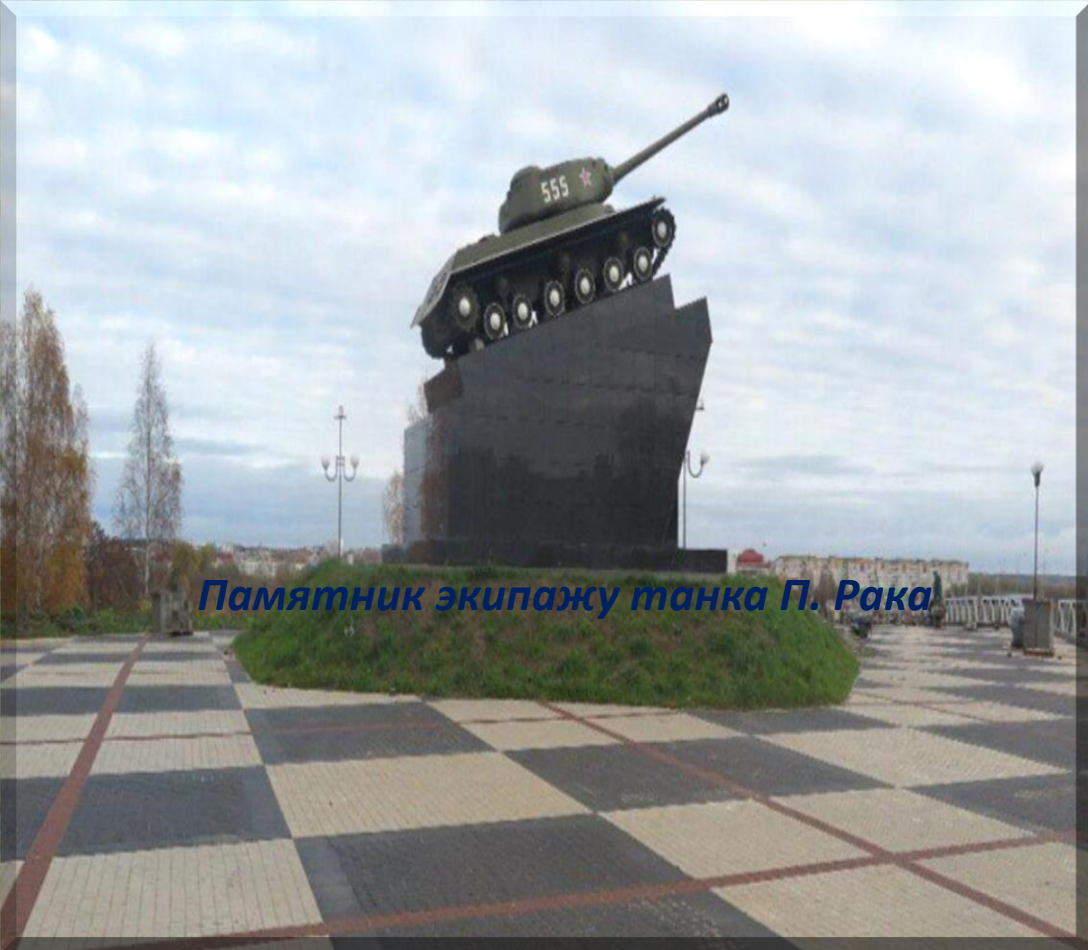
Памятник экипажу танка П. Рака

В г. Борисов находится замечательный памятник, который напоминает людям о событиях 1944 года. Война забрала много военнослужащих, которые старались защитить страну от фашистов. Однако благодаря смелым и отважным теперь Беларусь является совершенно свободной. Поэтому увековечить память армии было обязанностью народа, который возвел для этого конструкцию. Экипаж танка П. Рака отметил с лучшей стороны, смог принести победу, поэтому жители и гости города могут теперь порадоваться ему.