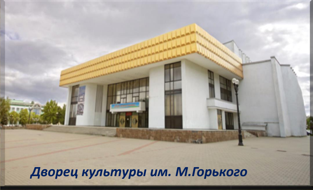
Дворец культуры им. М.Горького