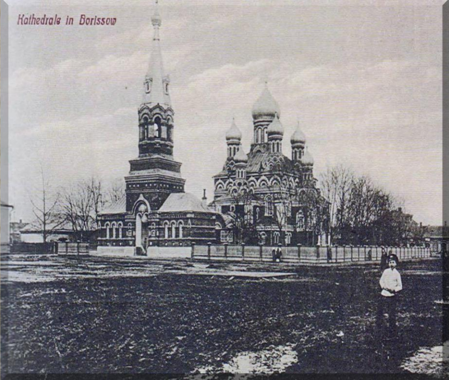
Kathedrale in Borissow