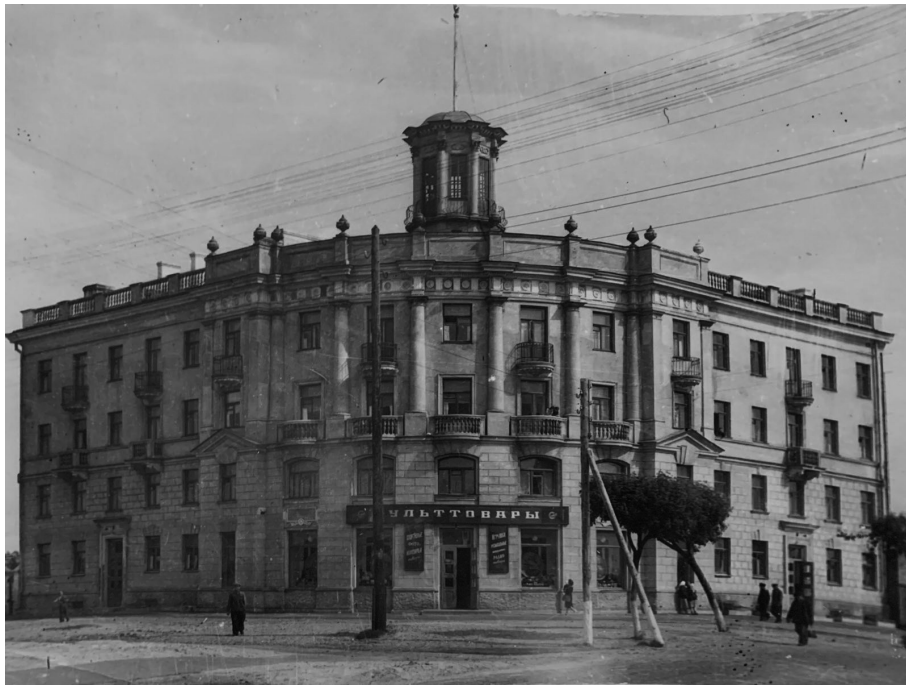
Н. Белица. Жилой дом для рабочих Домостроительного комбината, г. Гомель, 1955 г.