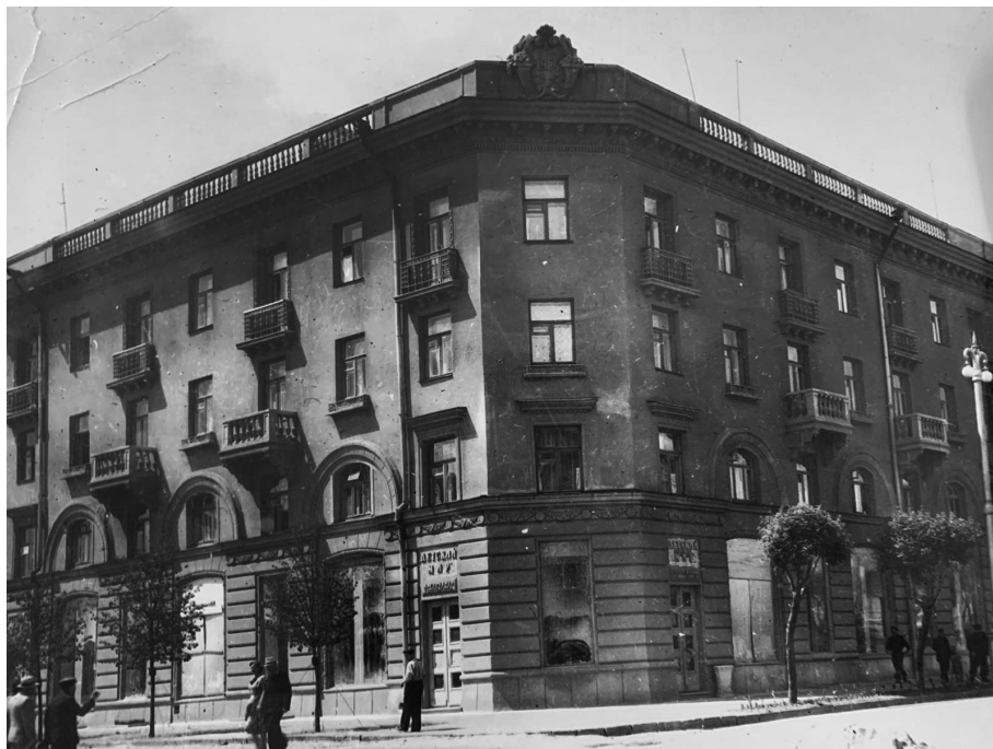
Новый жилой дом и магазин «Детский мир» по Советской улице (артель «Фототруд»), г. Гомель, 1957 г.