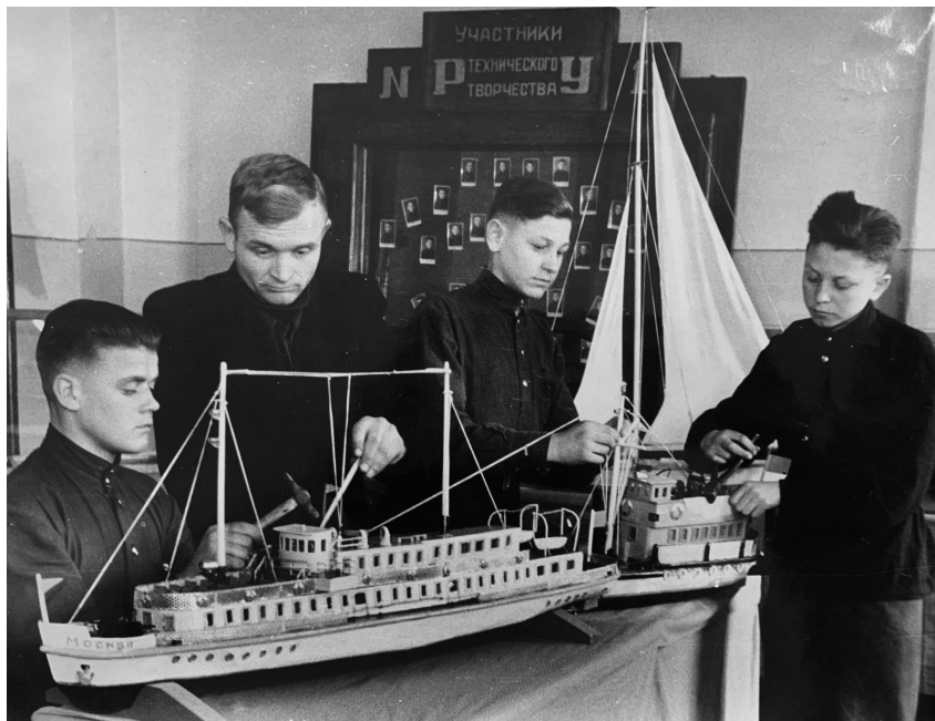
Гомельское ремесленное училище речников № 1. Кружок морского моделизма. г. Гомель, 1955 г.