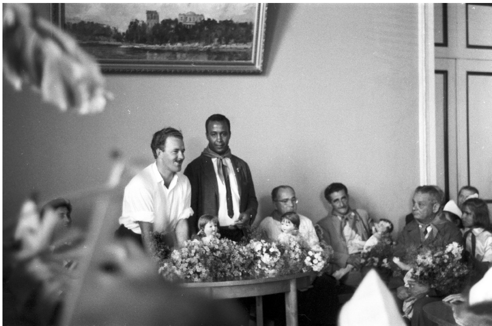
Член бразильской делегации приветствует кружковцев Гомельского Дворца пионеров и школьников, 1963 г., г. Гомель