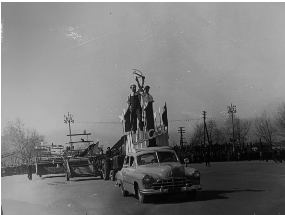
Головная колонна з-да «Гомсельмаш» на демонстрации, г. Гомель, 1 мая 1958 г.