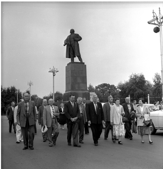
Члены делегации Федерации русских канадцев у памятника В. И. Ленину, 1959 г., г. Гомель