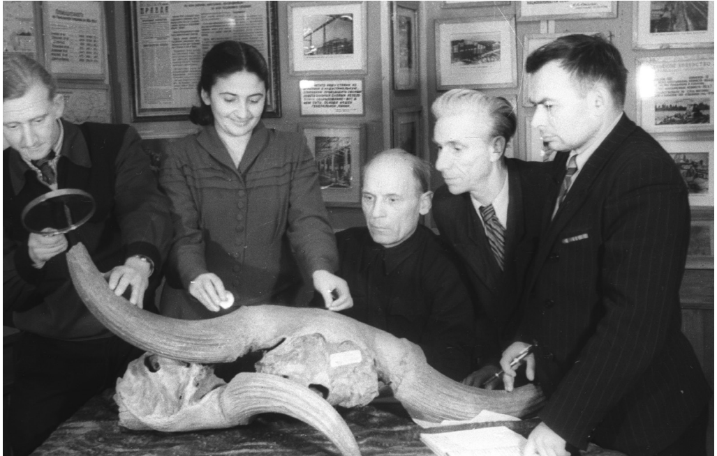
Научные сотрудники Гомельского областного краеведческого музея осматривают кости черепа гигантского зубра, найденные при раскопках на окраине г. Гомеля, 1954 г., г. Гомель