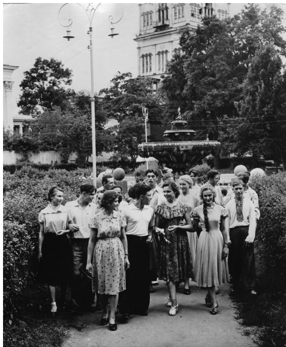
Воскресный день. Рабочие завода «Гомсельмаш» в парке им. Луначарского, г. Гомель, 2-я половина 1950-х гг.