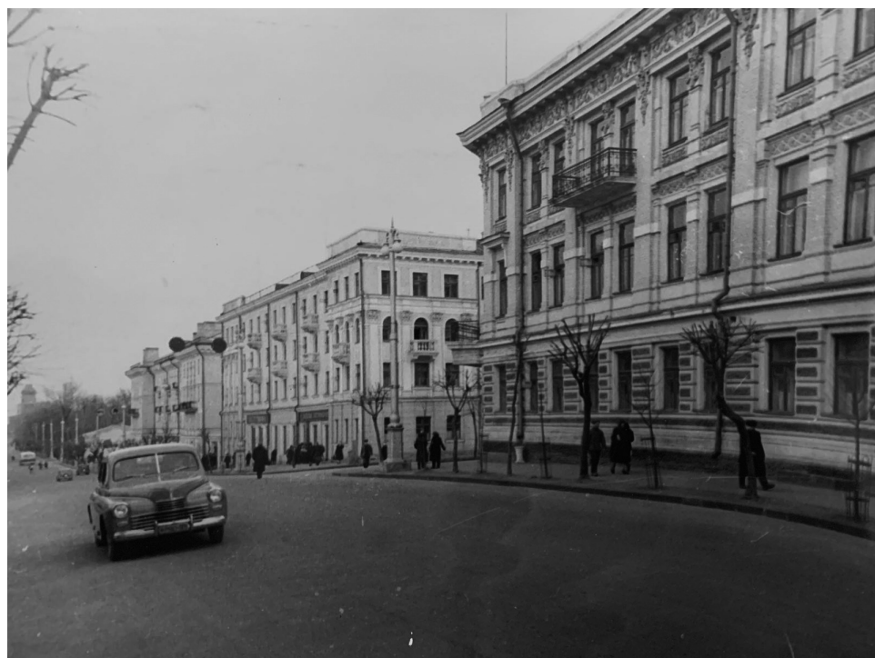
Вид Советской улицы в г. Гомель, г. Гомель, 1956 г.