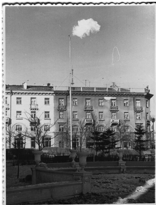
Гомель получил природный газ (торжественное мероприятие), г. Гомель, 1960 г.