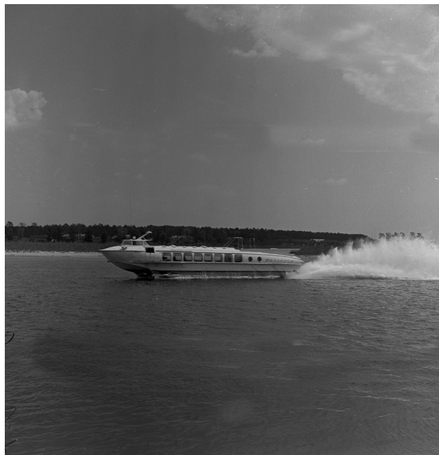
Первый в республике теплоход на подводных крыльях «Беларусь», выпущенный Гомельским судостроительно-судоремонтным заводом, на рейсе по маршруту Гомель-Славгород, 1964 г., г. Гомель