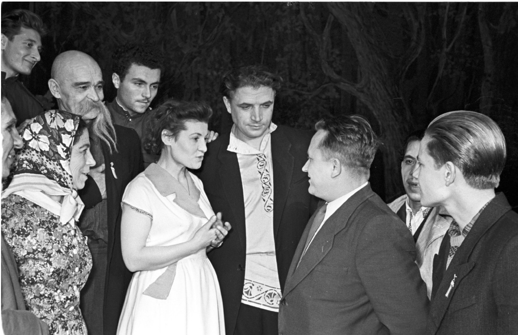
Белорусский писатель И. Шамякин среди артистов драматического коллектива Гомельского Дворца культуры им. Ленина после премьеры спектакля по пьесе «Не верьте тишине», 1958 г., Гомельская обл.