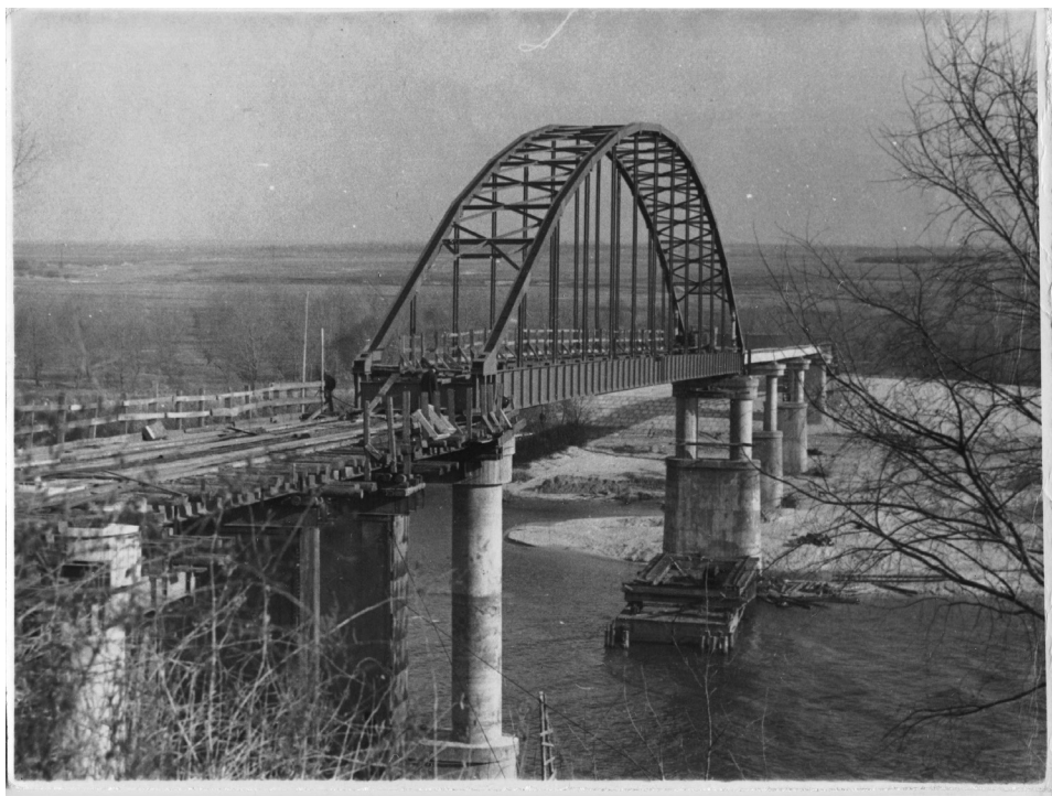
Строительство пешеходного моста через реку Сож, г. Гомель, 1960 г.