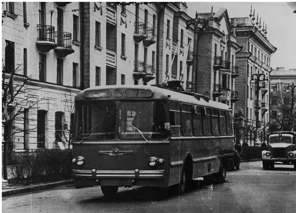
Первый рейс троллейбуса г. Гомель, проспект им. Ленина 1962 г., г. Гомель, 1962 г.