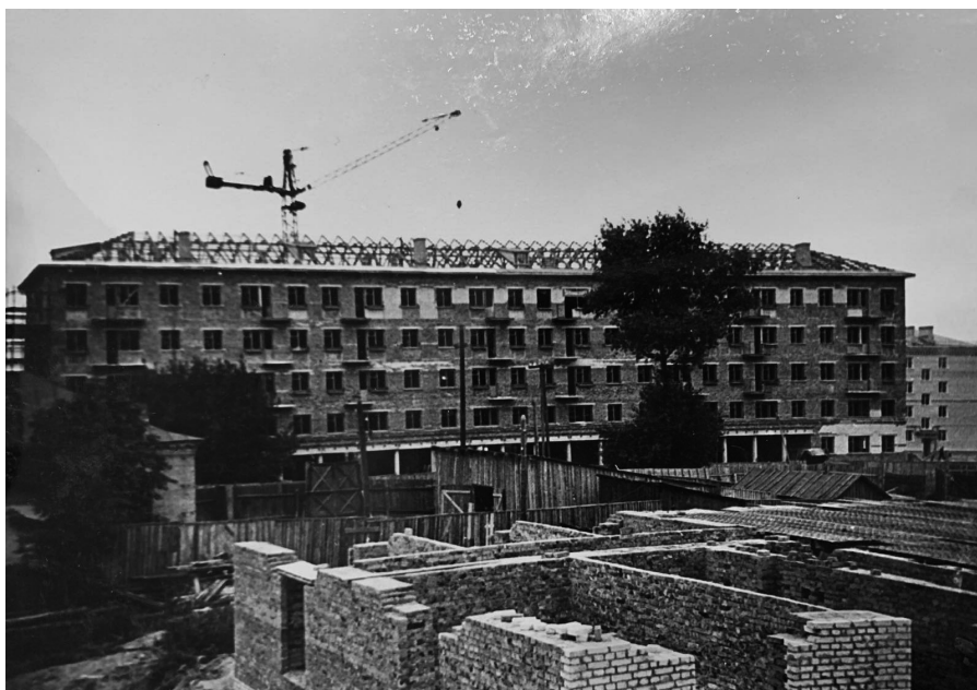
На улице Победы одной из первых в городе в 60-х годах было развернуто строительство типовых пятиэтажных домов, г. Гомель, 1-я половина 1960-х гг.