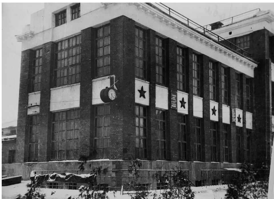
Общий вид хлебокомбината по Комсомольской улице, г. Гомель, 1955 г.