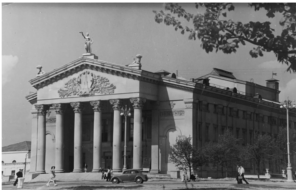
Здание облдрамтеатра на площади имени Ленина, г. Гомель, 24.10.1955