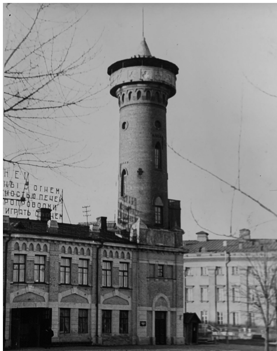
Пожарная каланча, г. Гомель, 1957 г.