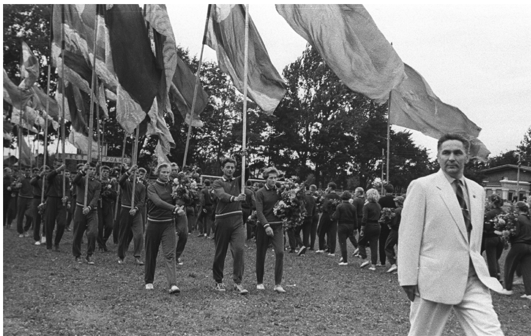
Парад участников первых Всебелорусских сельских спортивных игр, 1961 г., г. Гомель