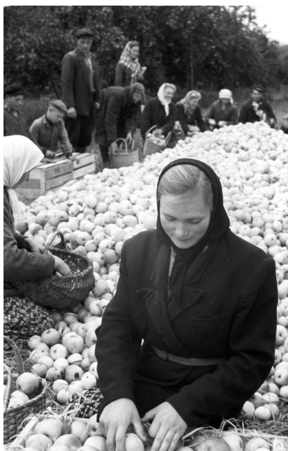
Рабочие Речицкого совхоза «10 лет Октября» за упаковкой яблок для отправки в леспромхозы Карельской АССР, 12 октября 1956 г., обл. Гомельская