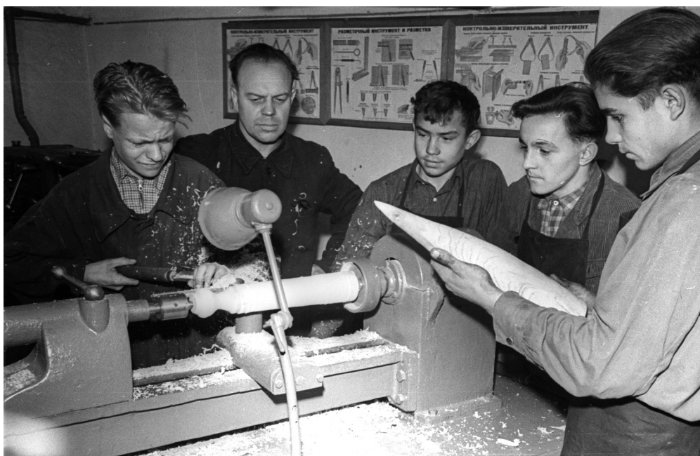
Ученики 10 класса средней школы № 18 г. Гомеля у сконструированного ими токарного станка, позволяющего производить точные работы по дереву, 1959 г., г. Гомель