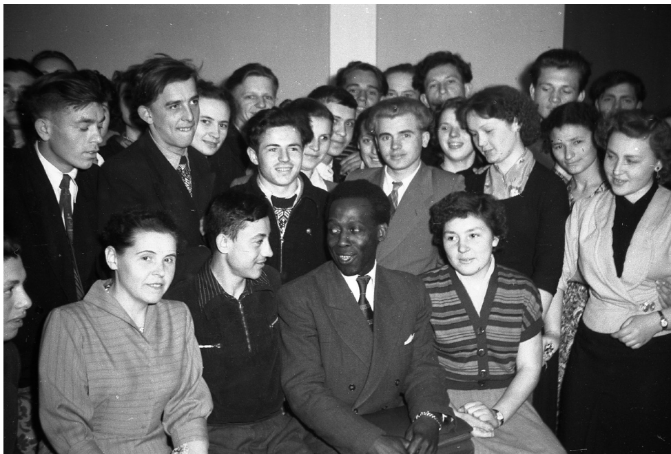
Американский киноактер Роберт Росс среди участников молодежного вечера во Дворце культуры им. Ленина в г. Гомеле в дни пребывания в БССР, 1957 г., г. Гомель