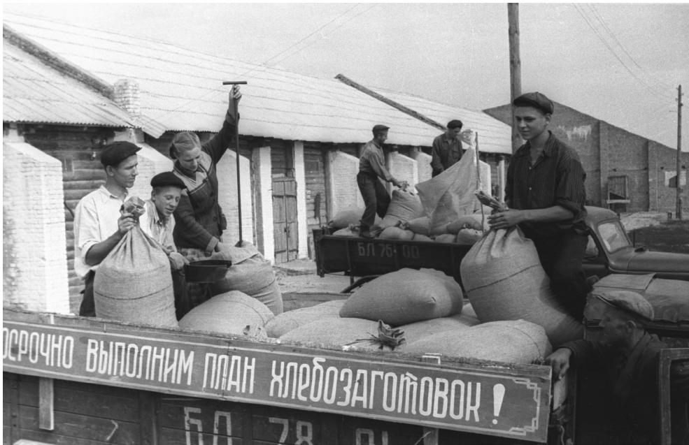
Сдача зерна колхозниками на Уваровичский пункт «Заготзерно», 20 июля 1954 г., обл. Гомельская