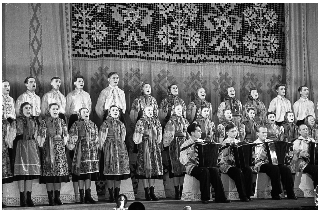
Выступление хора колхоза «Новая жизнь» Туровского р-на Гомельской области на заключительном концерте в Государственном академическом Большом театре оперы и балета Союза ССР в дни Декады белорусского искусства и литературы в г. Москва, 24 февраля 1955 г., г. Москва