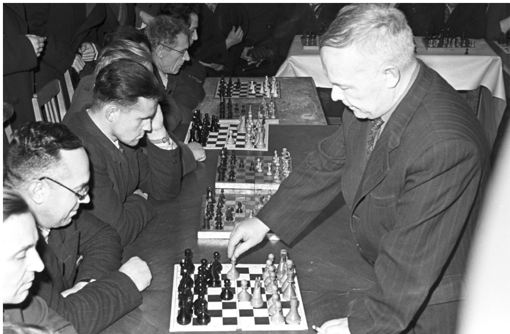
Международный мастер по шахматам Г. Н. Вересов во время сеанса игры на 21 доске с шахматистами г. Гомеля, 1960 г., г. Гомель