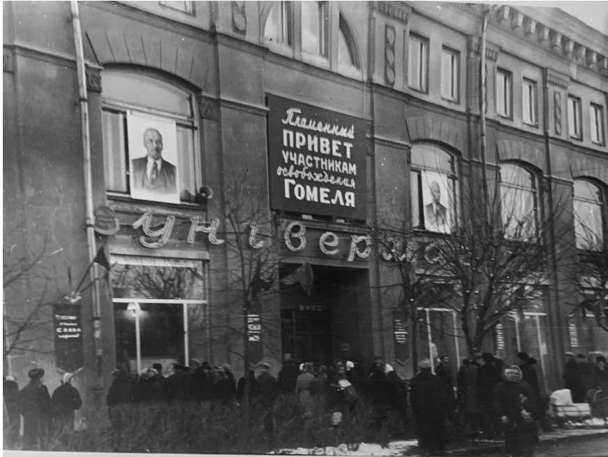
Город готовится к торжественной дате 20-летия со дня освобождения города от немецко-фашистских захватчиков. На снимке оформление здания универсама к торжествам, г. Гомель, 22 ноября 1963 г.