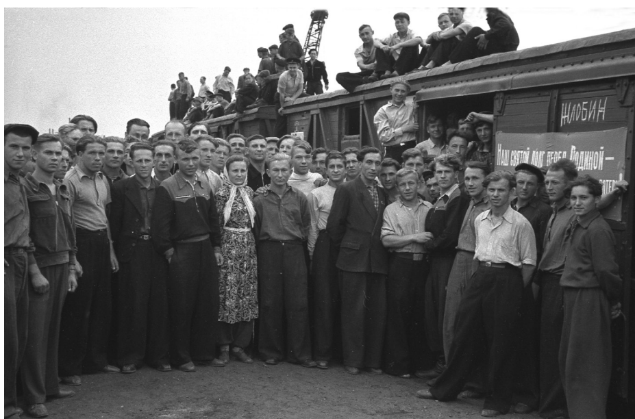
Молодежь Гомельской области, изъявившая желание поехать в Казахстан на уборку урожая, перед отправкой на вокзале Гомеля, 15 июня 1956 г., г. Гомель