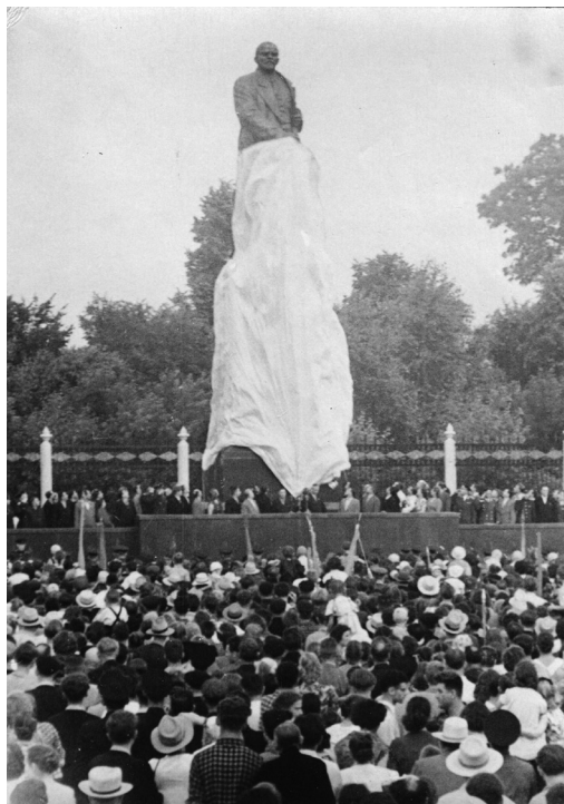
Открытие памятника Ленину, г. Гомель, 1958 г.