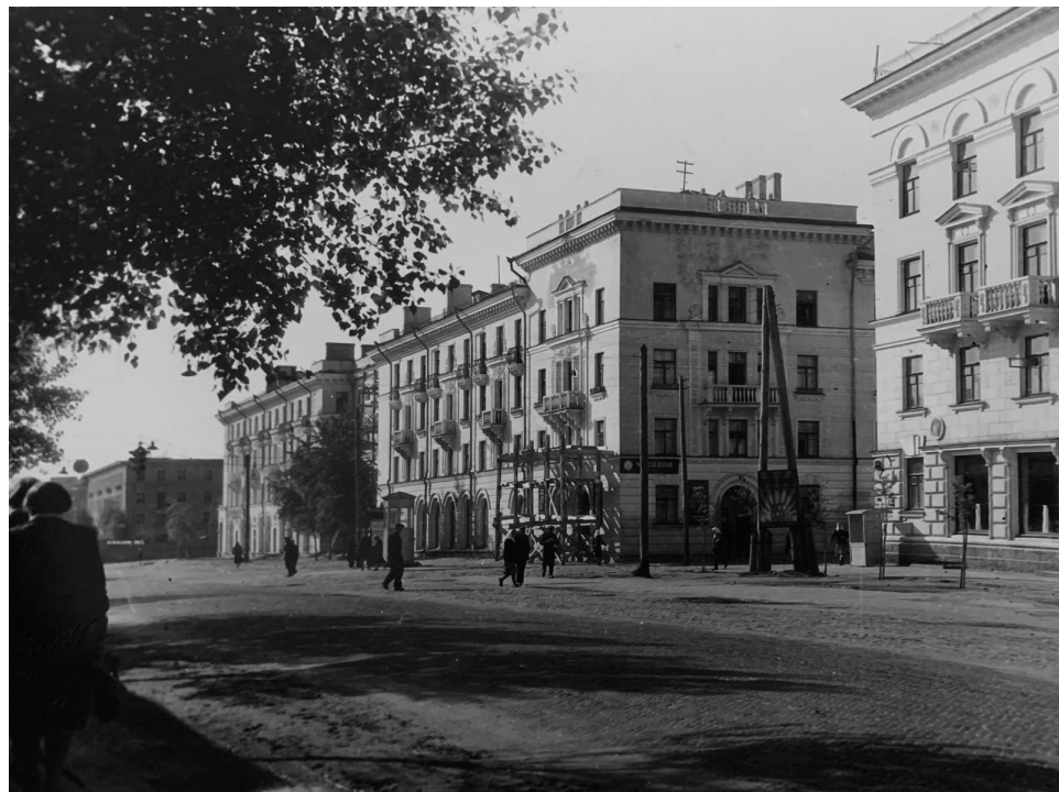
Новые дома по Комсомольской улице, г. Гомель, 1958 г.