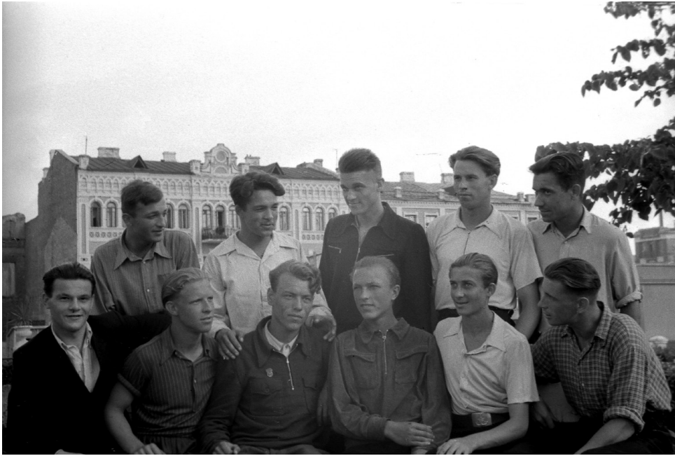
Группа студентов Гомельского автомобильно-дорожного техникума, изъявивших желание поехать на уборку целинного урожая, 25 июня 1956 г., г. Гомель