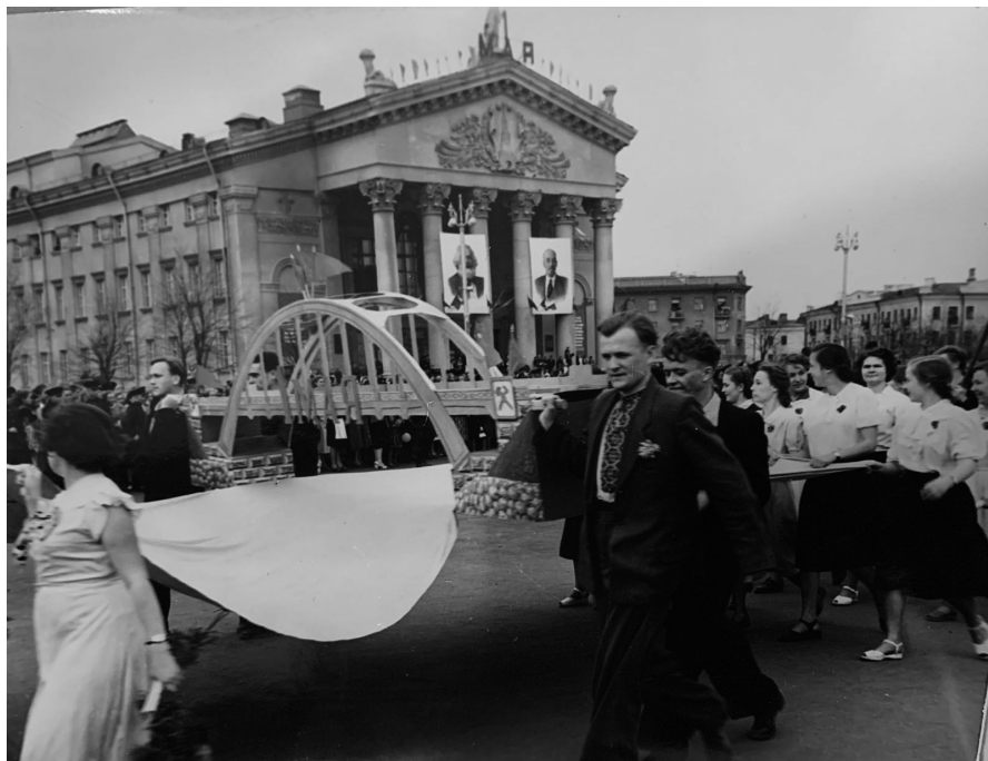
Празднование 1 мая 1956г. в Гомеле студенты БИИЖТ на демонстрации, г. Гомель, 1956 г.