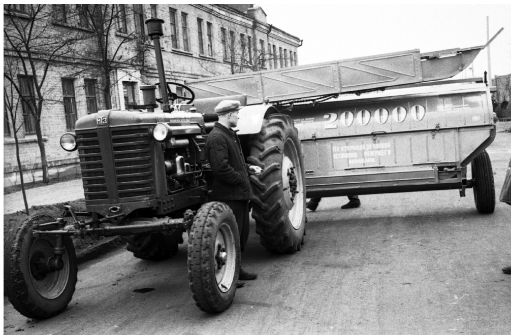
200000-тысячный комбайн – продукция Гомельского завода сельскохозяйственного машиностроения «Гомсельмаш», 1963 г., г. Гомель