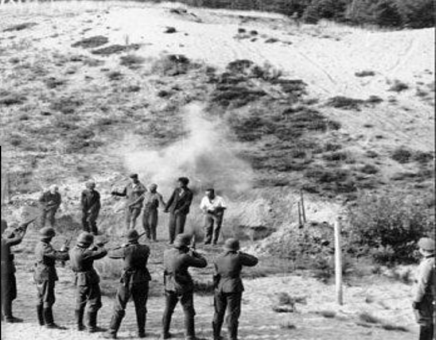
Поименные списки расстрелянных, повешенных, замученных граждан СССР г. Вилейка ЗГА в г. Молодечно Ф.2257.Оп.1.Д.9