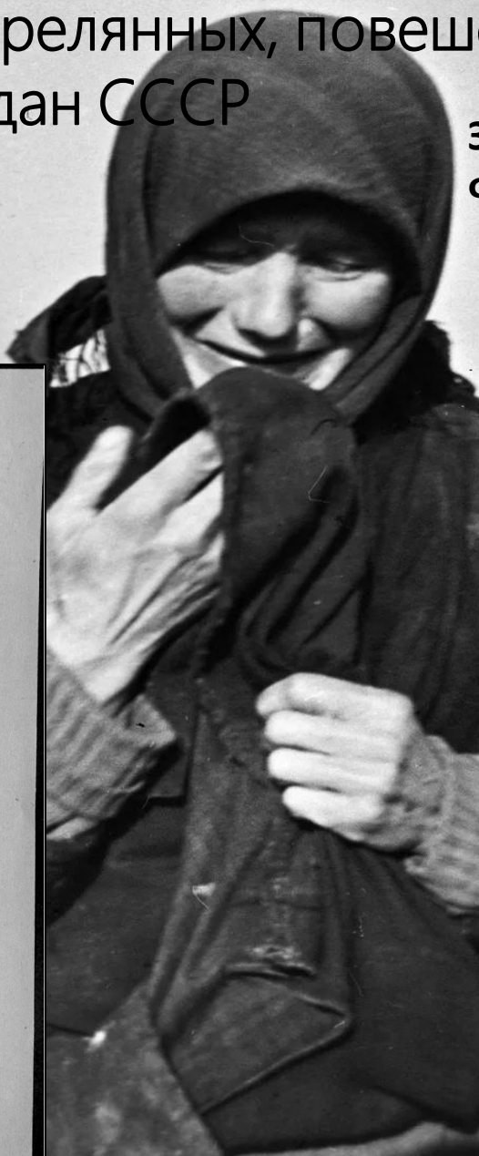
фотографии носят иллюстративный характер