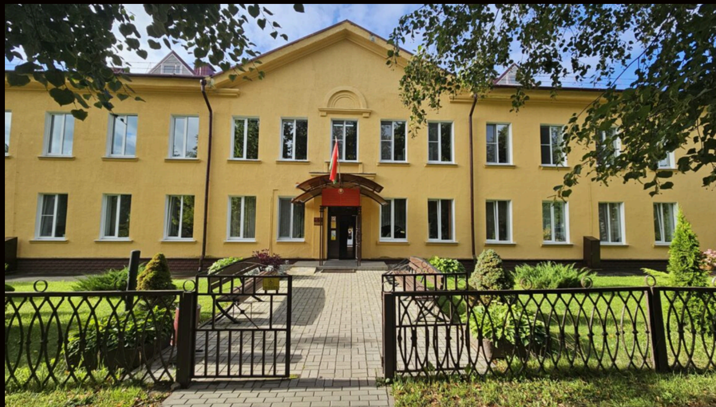
Здание ГУ «Молодечненский зональный центр гигиены и эпидемиологии»

Государственным учреждением «Молодечненский зональный центр гигиены и эпидемиологии» (далее — Молодечненский зональный ЦГЭ) проводится мониторинг среды обитания, контролируются параметры загрязнения питьевой и речной воды, атмосферного воздуха и воздуха рабочей зоны, продуктов питания и товаров народного потребления, проводится государственная гигиеническая регистрация товаров народного потребления. Лабораторная служба Молодечненского зонального ЦГЭ аккредитована на проведение 476 видов исследований.