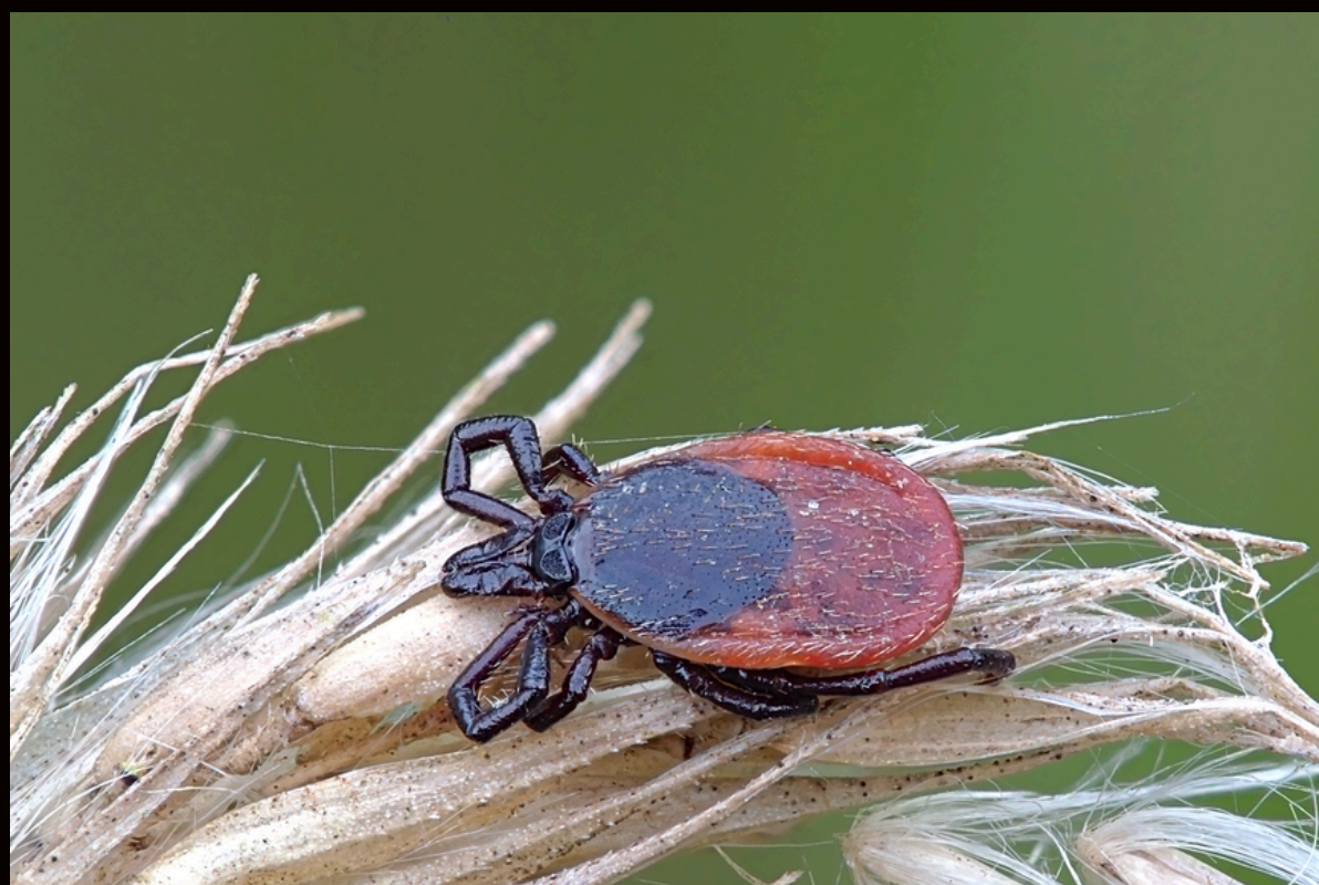
Клещ ( Ixodes ricinus )

В целях профилактики малярии, клещевого энцефалита и др., санитарная станция проводила мероприятия по исследованию и выявлению природных очагов заболеваний, подготовке методических рекомендаций и прочее.